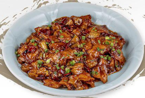
ШОШНЫ СҮМСЭНД ЖИГНЭСЭН ЗАГАС, ХАШТАЙ ХУУРГА Braised Fish with Eggplant in Bean Sauce 茄子酱烧鱼 70,800₮