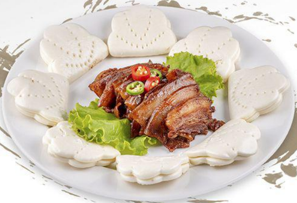
МАНТУУТАЙ ГАХАЙН ЦОРОЙ Braised Pork Belly with Steamed Bun 扣肉夹馍 46,800₮