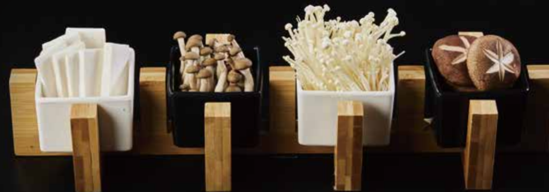
杏鲍菇 Eingi Mushroom エリンギ RMB 28元