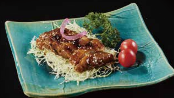
鸡排 Chicken チキン RMB 68 元