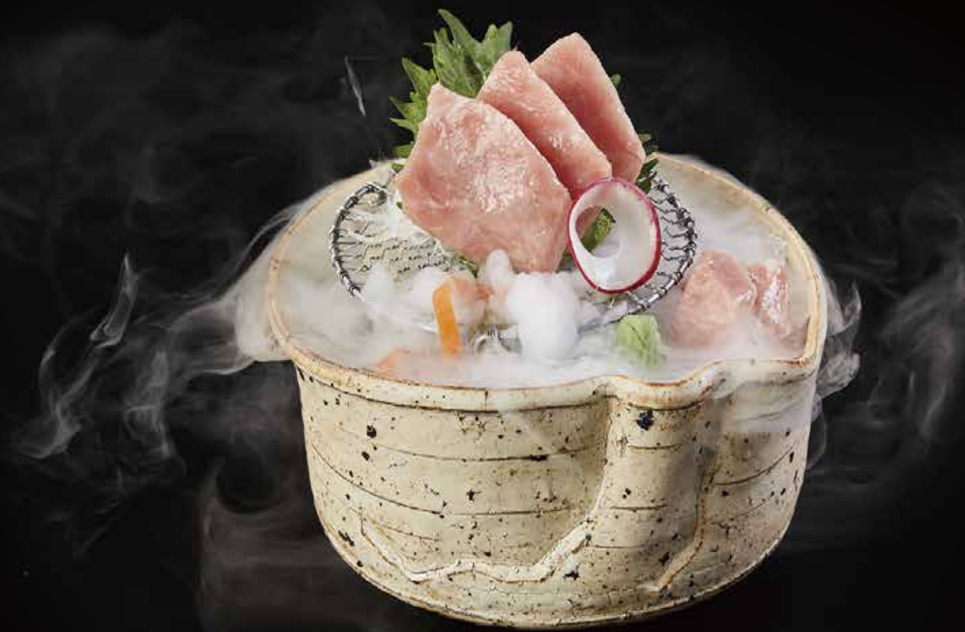
金枪鱼油脂 Tuna Belly マグロトロ RMB 188 元