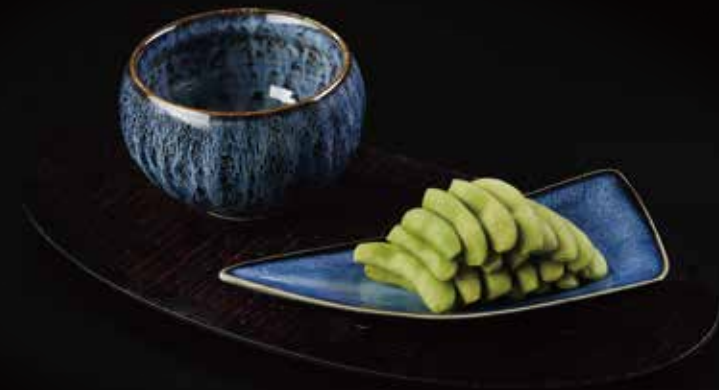
日式毛豆 Soya Bean 枝豆 RMB 28 元