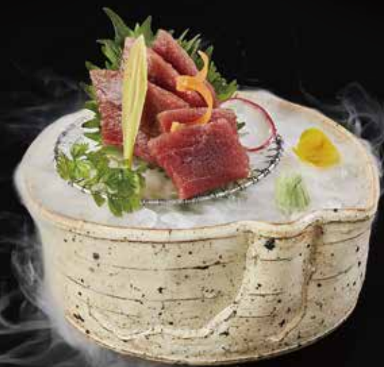
金枪鱼 Tuna マグロ RMB 98 元