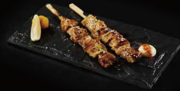
葱间串 Leek With Chicken ねぎま RMB 35 元