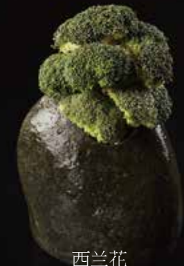
西兰花 Broccoli ブロッコリ RMB 18元