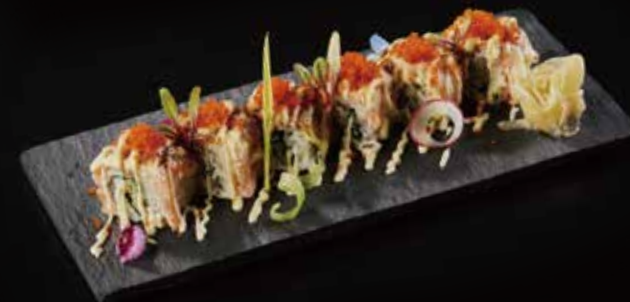
火炙三文鱼卷 Seared Salmon Roll 鮭炙りロール RMB 88 元