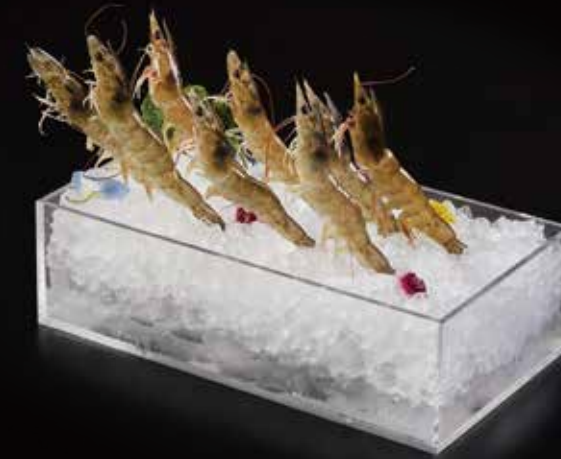
基围虾 Shrimp Ji Wei (100g) ヨシ海老 RMB 68 元