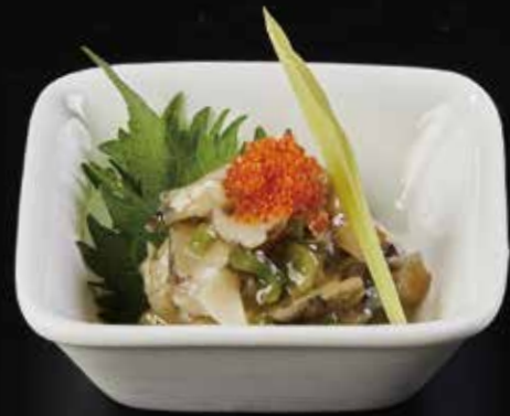
芥末海螺 Wasabi Conch サザエわさび RMB 28 元