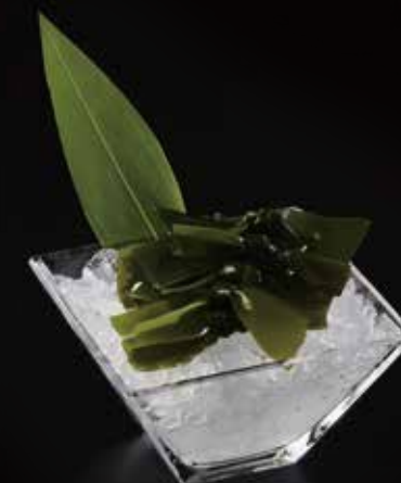
海带苗 Laminaria Japonica 若芽 RMB 38元