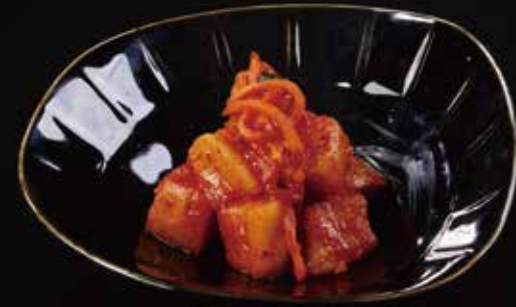
萝卜泡菜 Kimchi Radish カクテキ RMB 28 元