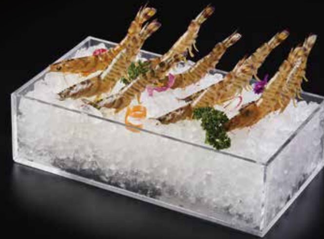
斑节虾 Kuruma Shrimp 車エビ RMB 78 元