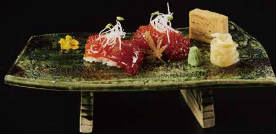
三文鱼筋子握 Salmon Sujiko Nigiri 鮭すじにぎり RMB 88 元