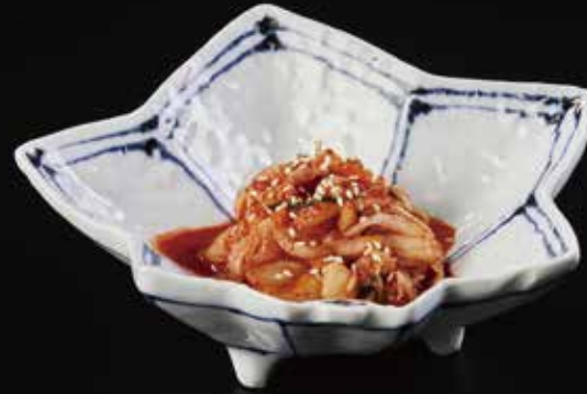
日式泡菜 Kimchi Cabbage キムチ RMB 28 元