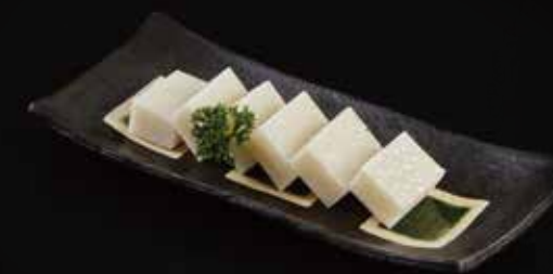
日本年糕 Japanese Rice Cake お餅 RMB 28元