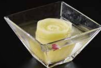
功夫土豆 Kung Fu Potato じゃがいも RMB 28元