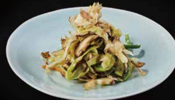
时蔬 Vegetables 鉄板の焼野菜 RMB 38 元