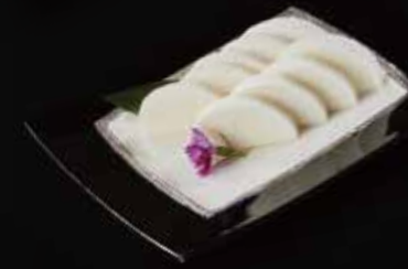
白萝卜 Radish 大根 RMB 18元