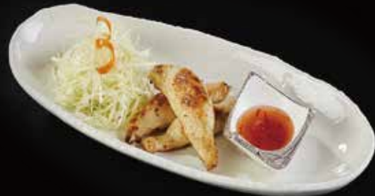
鸡皮煎饺 Chicken Skin Gyoza 鳥皮餃子 RMB 48 元