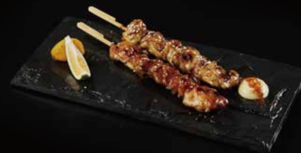
特大鸡腿肉串 Yaki Tori やきとり(もも) RMB 38 元