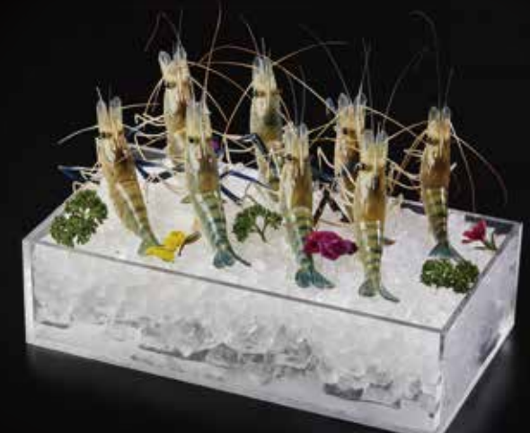
大头虾 Shrimp Big Head (100g) 手長川海老 RMB 38 元