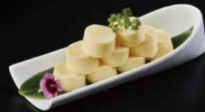
玉子豆腐 Egg Tofu 玉子豆腐 RMB 18元