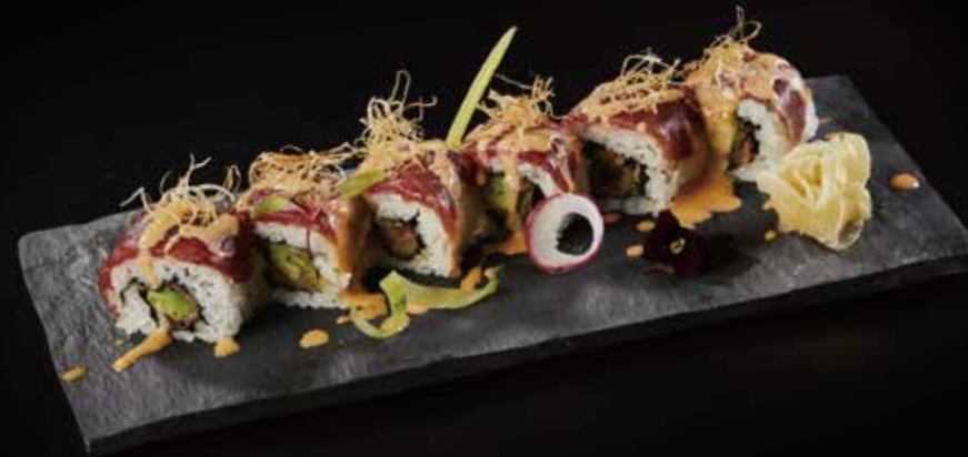
辣味金枪鱼卷 Spicy Tuna Roll スパイシーマグロロール RMB 98 元