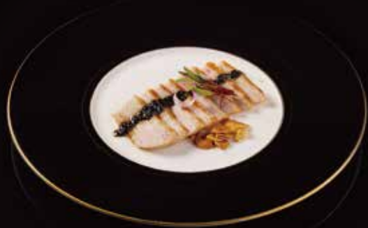
烤猪颈肉 Grilled Pork Neck トントロ RMB 48 元