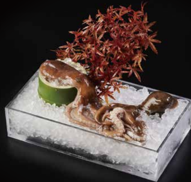
八爪鱼 Octopus (100g) たこ RMB 38 元