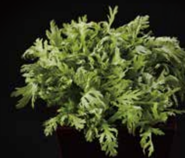
茼蒿 Kikuna 菊菜 RMB 28元