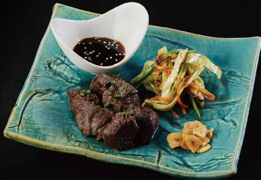
牛菲力 Beef Fillet 牛フレイ RMB 168 元