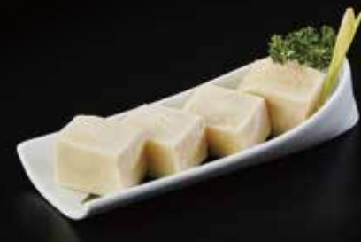
冻豆腐 Frozen Tofu 冷凍豆腐 RMB 18元