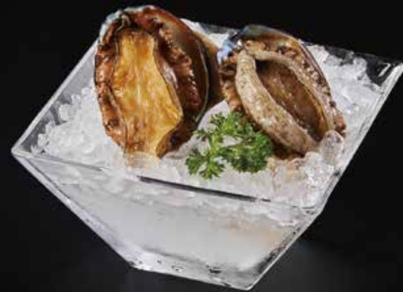
小鲍鱼 Baby Abalone あわび RMB 38 元