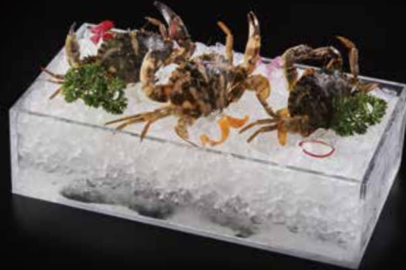
石头蟹 Stone Crab (100g) 石カニ RMB 48 元