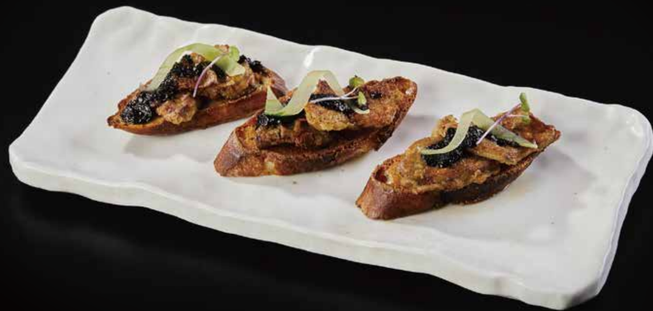
法式香煎鹅肝 Goose Liver フォアグラ RMB 128 元