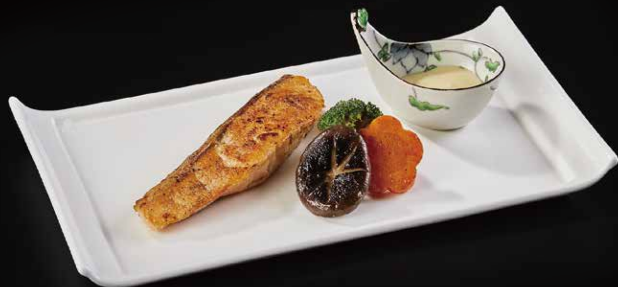
三文鱼 Salmon サーモン RMB 98 元