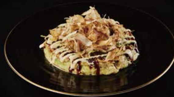
大阪烧 Okonomiyaki お好み焼き RMB 58 元