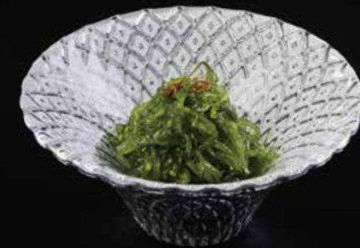
中华海藻 Seasoned Seaweed 味付海藻 RMB 25 元