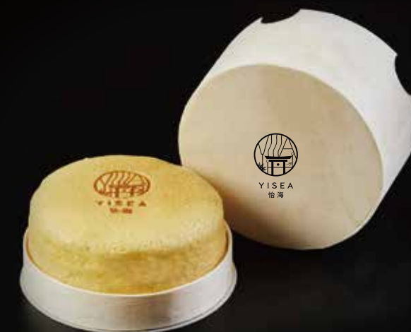
芝士蛋糕 Cheesecake チーズケーキ RMB 108元