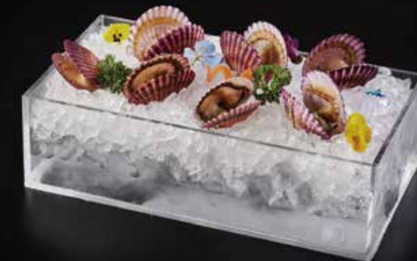
小红扇贝 Scallop Fan Red (100g) 赤ホタテ RMB 28 元