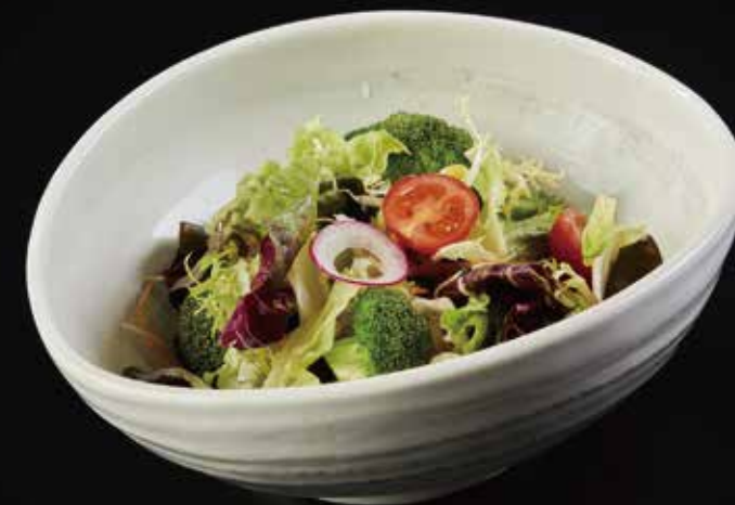
季节时蔬色拉配日式芝麻酱 Seasonal Vegetable Salad with Sesame Dressing 季節野菜のサラダと胡麻ドレッシング RMB 58 元