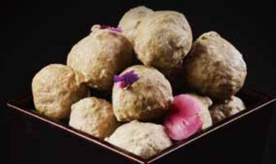
贡丸 Beef Meat Ball ビーフの団子 RMB 48元