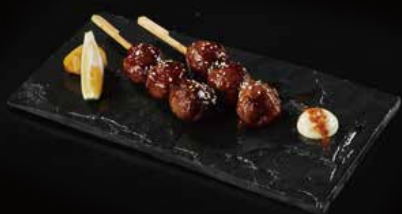
软骨鸡肉丸子 Chicken Cartilage Ball 软骨入りのつくね RMB 35 元