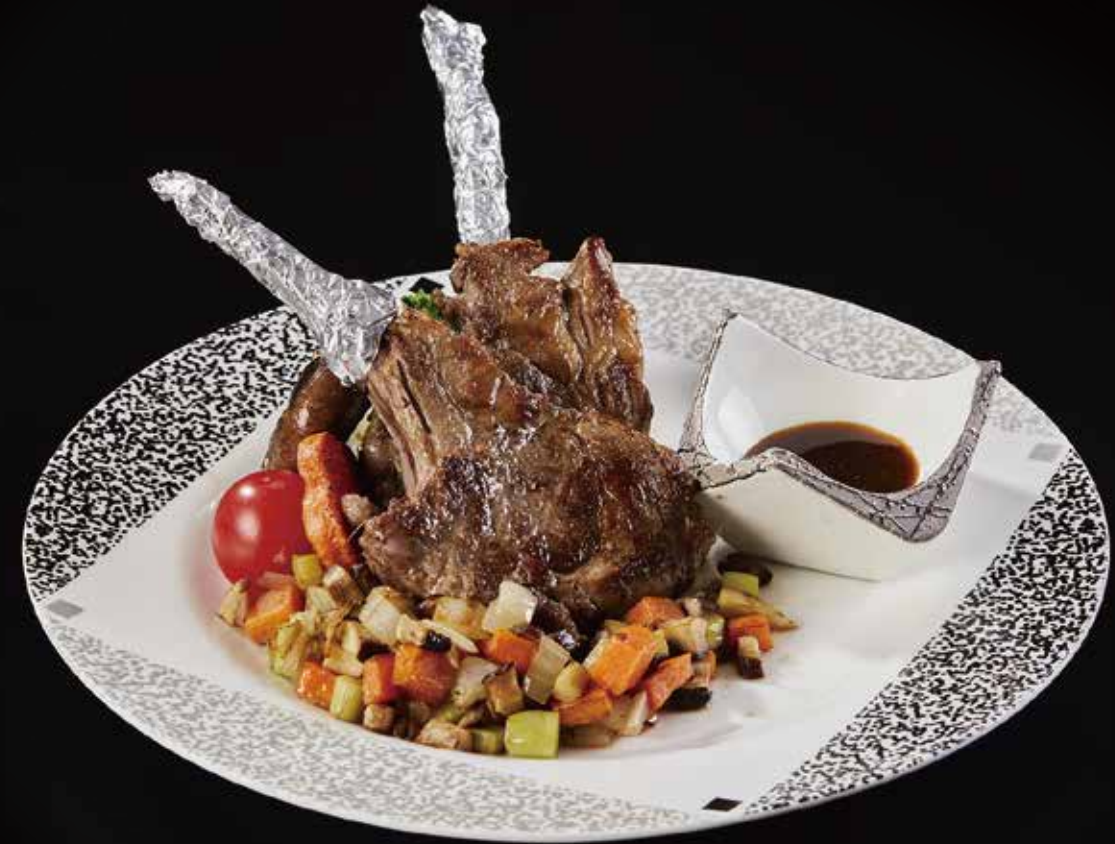
羊排 Lamb Chops ラムチョップ RMB 98 元