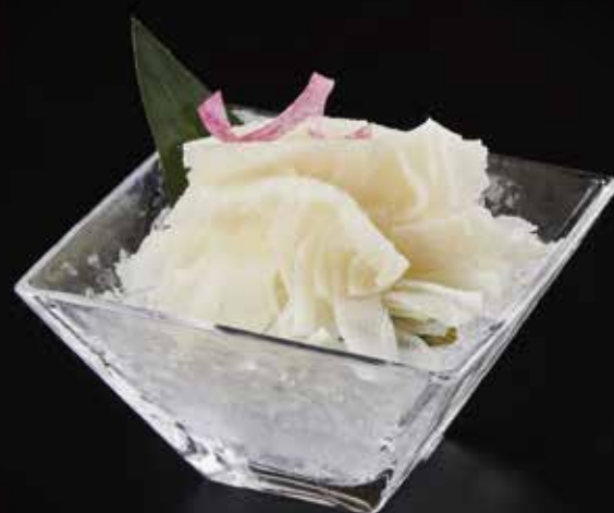
牛百叶 Beef Tripe (150g) ビーフのイブクロ RMB 98 元