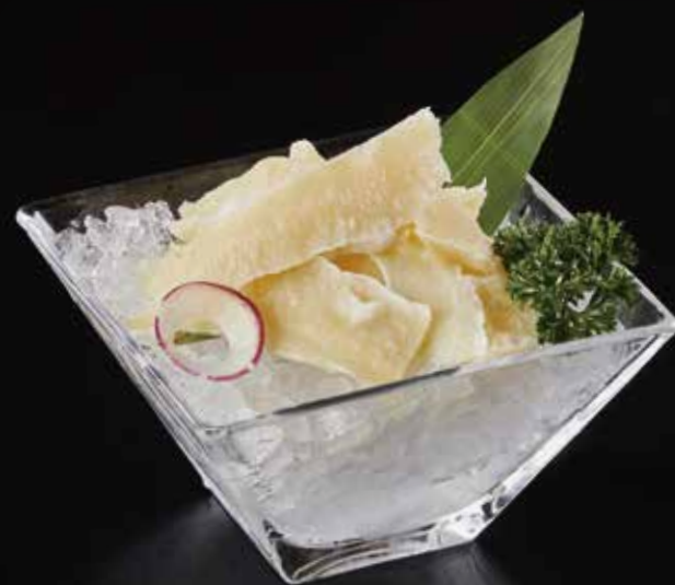
黄喉 Beef Throat (150g) ビーフの喉 RMB 78元