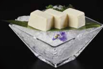
豆腐 Tofu 豆腐 RMB 18元