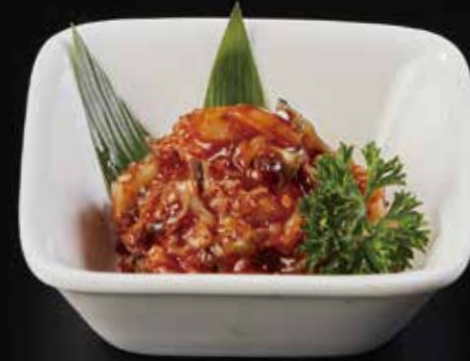
辣味鱿鱼骨 Spicy Squid Bone スパイシーイカ軟骨 RMB 28 元