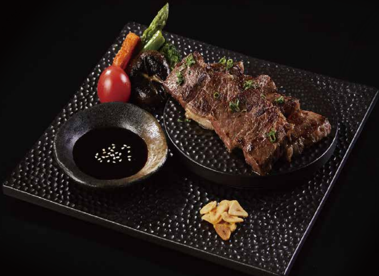
M7 和牛西冷 M7 Wagyu Beef Sirloin M7 和牛サーロイン RMB 458 元