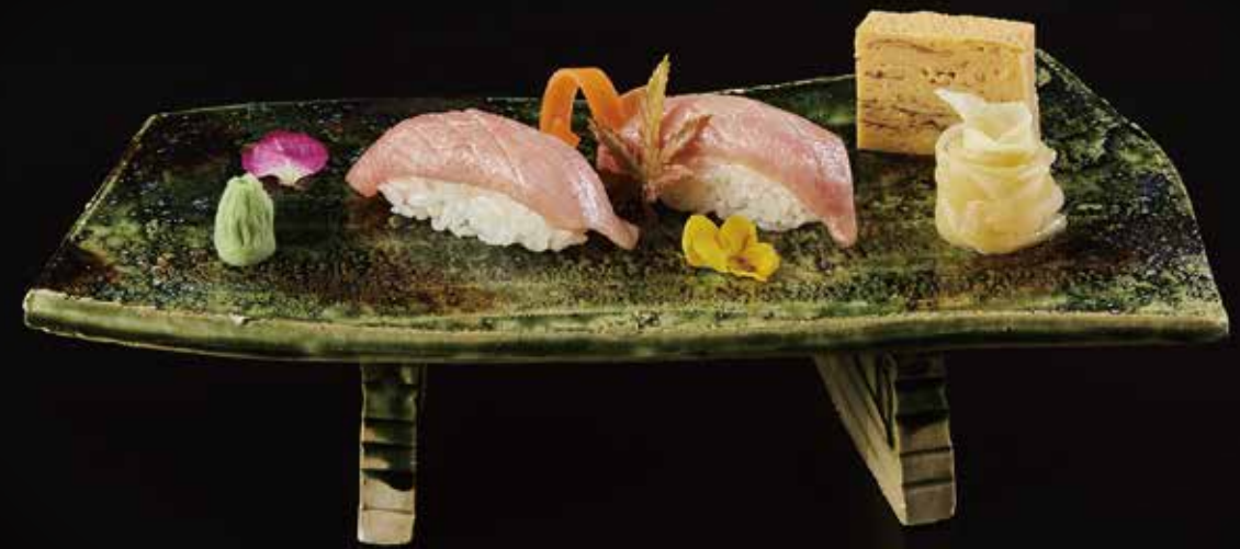
金枪鱼油脂握 Tuna Belly Nigiri マグトロ RMB 108 元