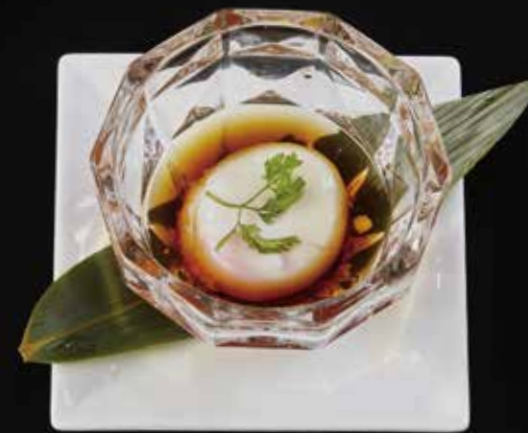
温泉朝一蛋 Hot Spring Egg 温泉玉子 RMB 28 元