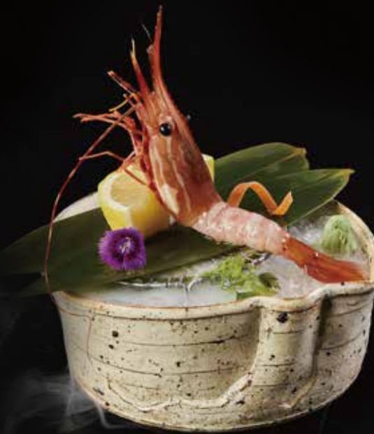
牡丹虾 Peony Shrimp (1pc) ほたん海老 RMB 88 元