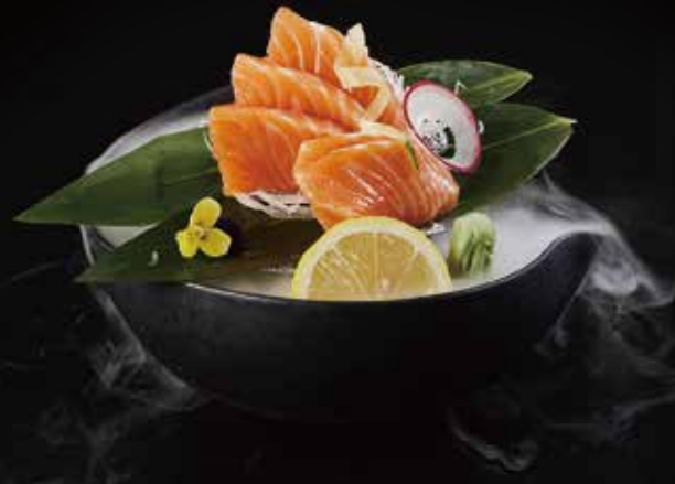
三文鱼 Salmon サーモン RMB 78 元