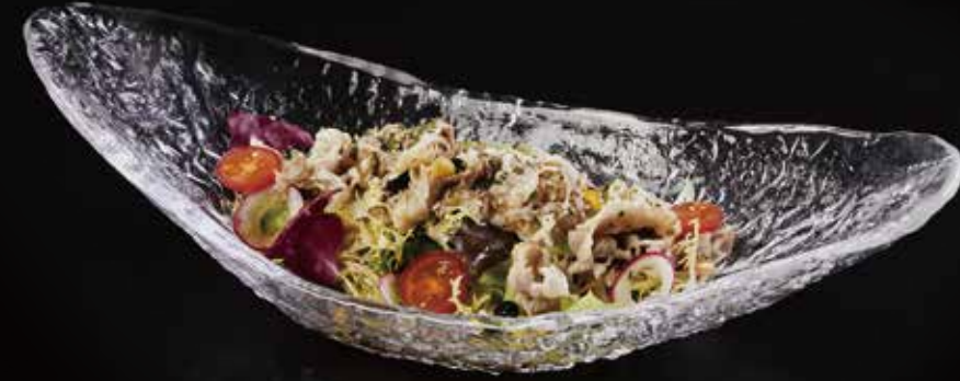
涮牛肉色拉配日式色拉汁 Beef Shabu-shabu Salad with Japanese Flavor Dressing 牛肉のしゃぶしゃぶサラダ RMB 88 元