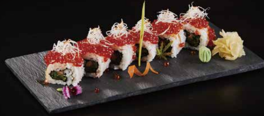
三文鱼筋子卷 Salmon Sujiko Roll 鮭すじこロール RMB 108 元