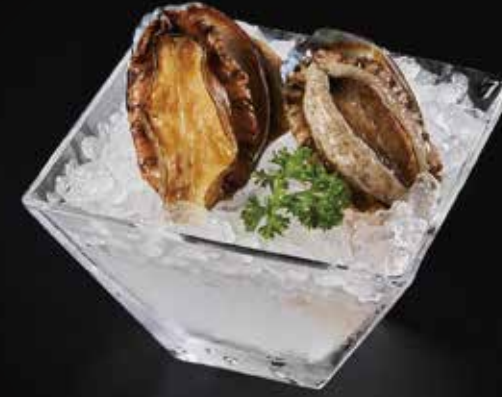
小鲍鱼 Baby Abalone (100g) ベビーアワビ RMB 58 元