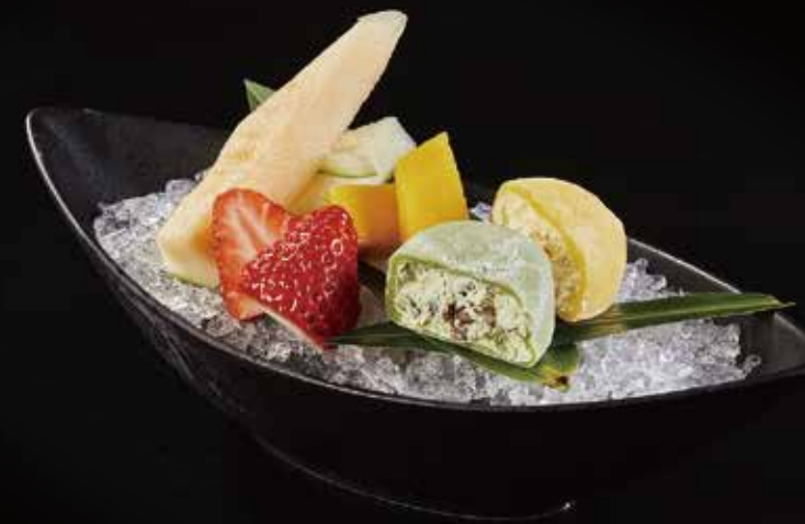
日式冰淇淋大福 (抹茶 / 芒果 / 芝麻) Rice Mochi (Matcha / Mango / Sesame) 大福餅のアイス (抹茶 / マンゴー / 胡麻) RMB 28元