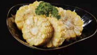
玉米 Corn トウモロコ RMB 18元