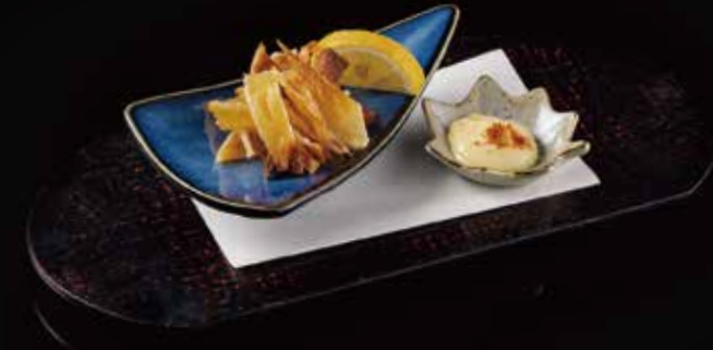
烤鳕鱼干 Grilled Skate エイヒレ RMB 48 元