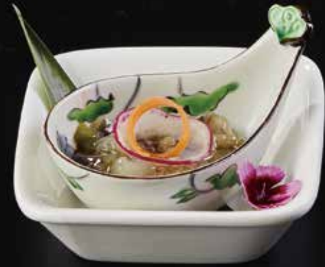
芥末章鱼 Wasabi Octopus 鱈わさび RMB 28 元