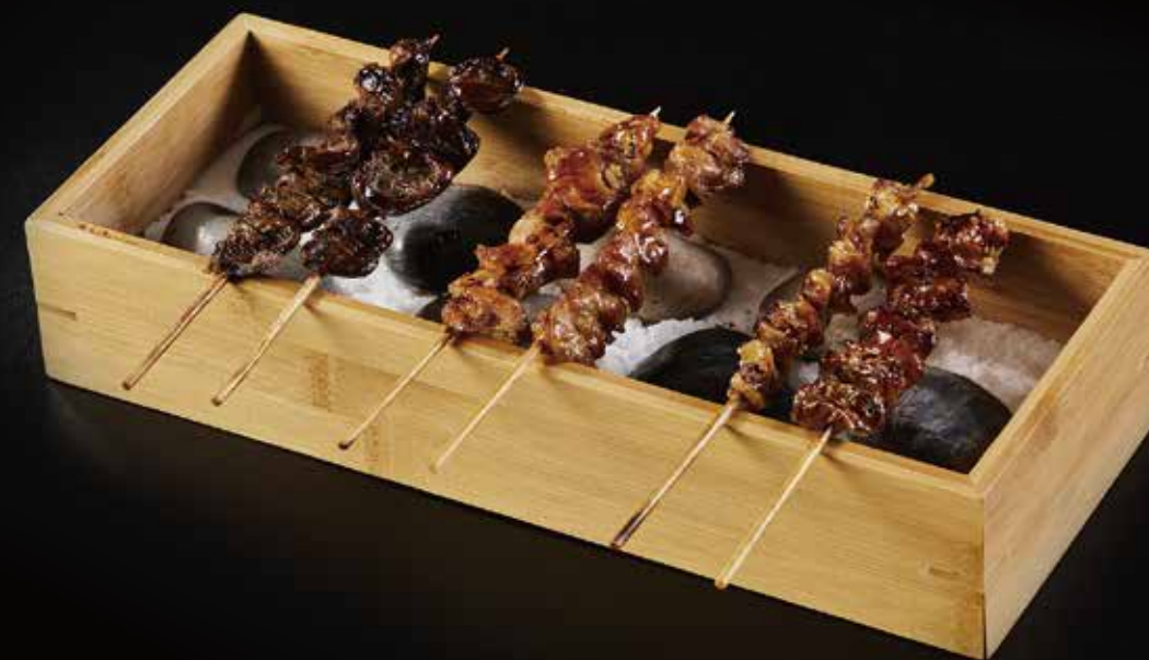
鸡心 Chicken Heart 鳥ハツ RMB 28 元