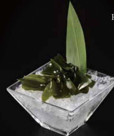
海带结 Kelp Knot 昆布結び目 RMB 28元