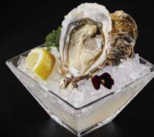
大生蚝 Oyster (1pc) カキ RMB 28 元