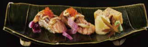
火炙三文鱼握 Seared Salmon Nigiri サーモン炙り RMB 48 元