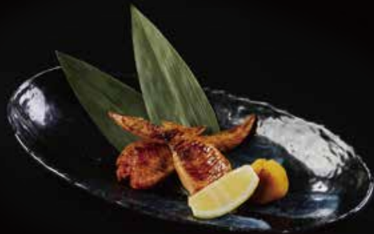
明太子鸡翅 Mentaiko Wings 明太子の手羽先 RMB 48 元