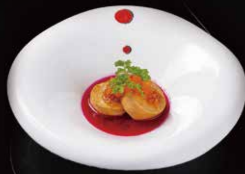
安康鱼肝 Monkfish Liver 鮫肝 RMB 68 元