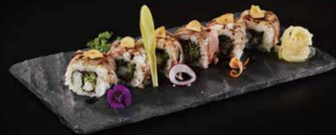
照烧牛肉卷 Beef Teriyaki Roll 牛肉照り焼きロール RMB 98 元