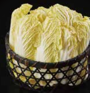
娃娃菜 Baby Cabbage ベビー白菜 RMB 18元