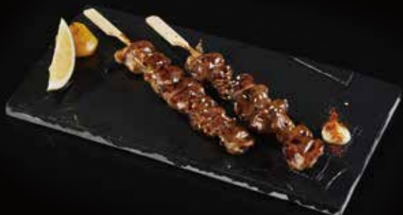
鸡胗 Chicken Liver 砂肝 RMB 38 元