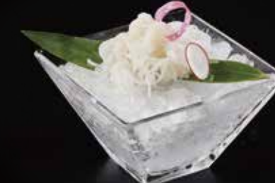
魔芋丝 Koniyaku 糸こんにゃく RMB 28元