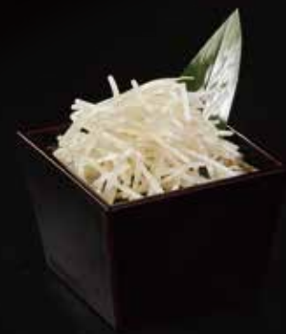
银芽 Silver Bud もやし RMB 18元