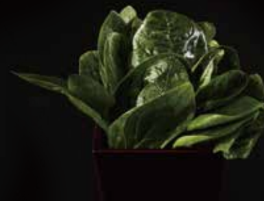
菠菜 Spinach ほうれん草 RMB 18元