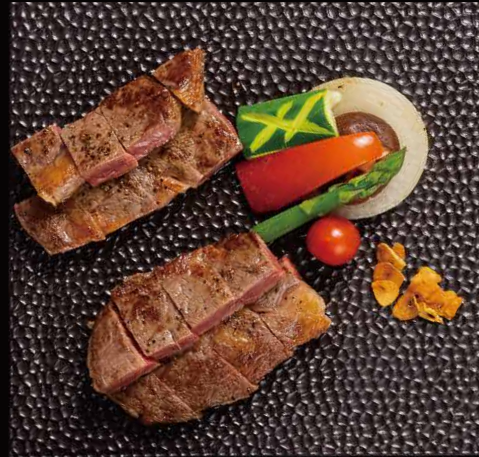
牛肉眼 Beef Rib-Eye 牛リブロス RMB 168 元