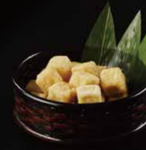
油豆腐 Fried Tofu 油揚 RMB 18元