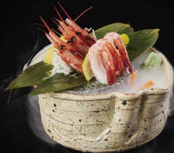
甜虾 Sweet Shrimp (3pcs) 甘エビ RMB 48 元