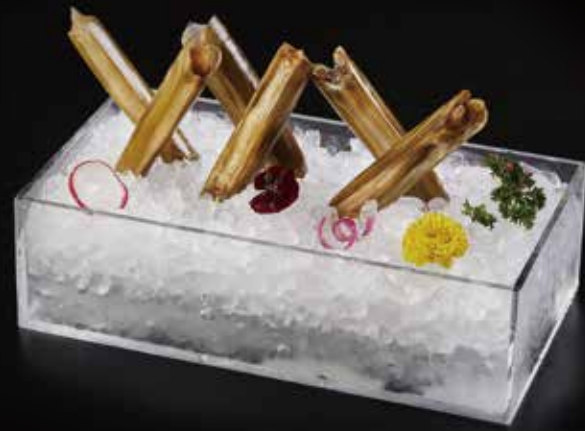
竹蛏 Razo Bamboo (100g) マデガイ RMB 58 元