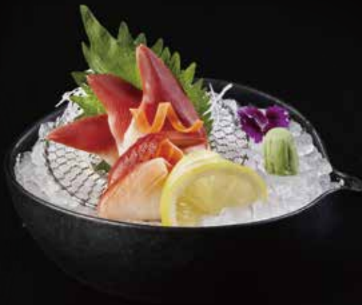
北极贝 Arctic Shellfish 北寄貝 RMB 68 元