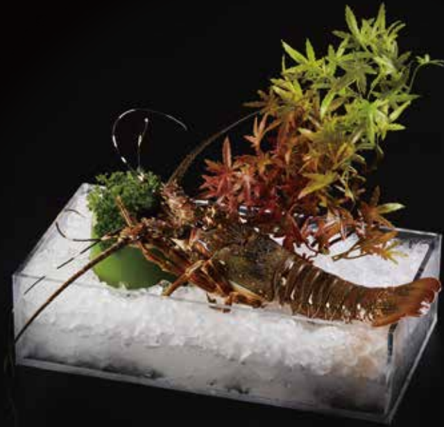
活小青龙 (火锅) Baby Lobster (HOT-POT) ロブスター (鍋) RMB 218 元