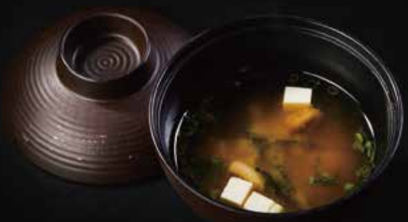
味噌汤 Miso Soup 味噌汁 RMB 18元