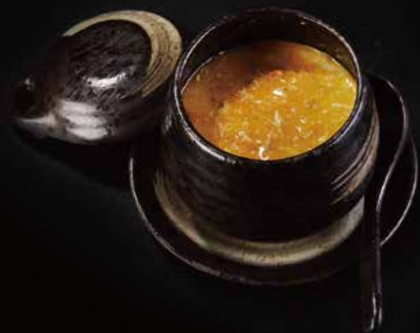
法式鹅肝蒸蛋 Foie Gras Steamed Egg フォワグラ茶碗蒸し RMB 68元