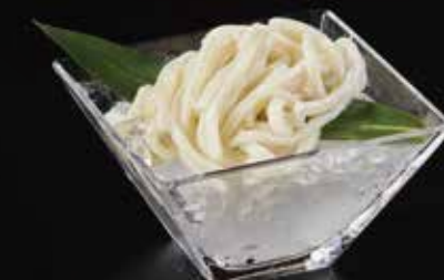
乌冬面 Udon Noodle うどん RMB 38元