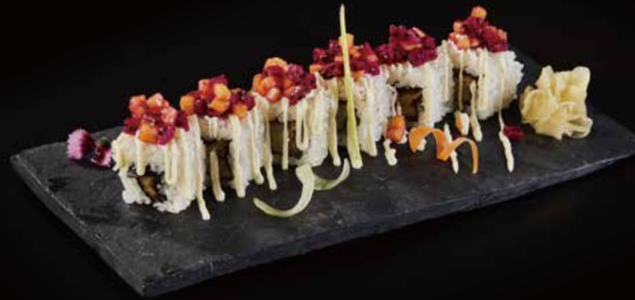
热带风暴卷 Tropical Storm トロピカルフルーツ RMB 68 元