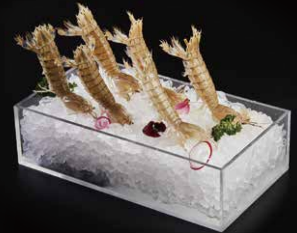
濼尿虾 Shrimp Mantis (100g) シャコ RMB 48 元