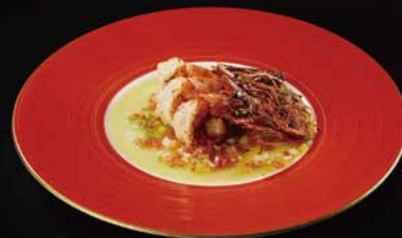
鲜虾 Shrimp 海老 RMB 78 元