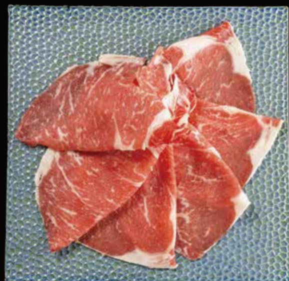
安格斯眼肉 Australian Beef Rib-eye (150g) オーストラリア牛のリブロス RMB 128 元