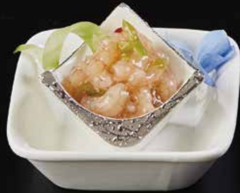
芥末甜虾 Wasabi Shrimp 甘えびわさび RMB 38 元