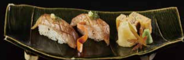
火炙金枪鱼握 Seared Tuna Nigiri マグロ炙 RMB 68 元