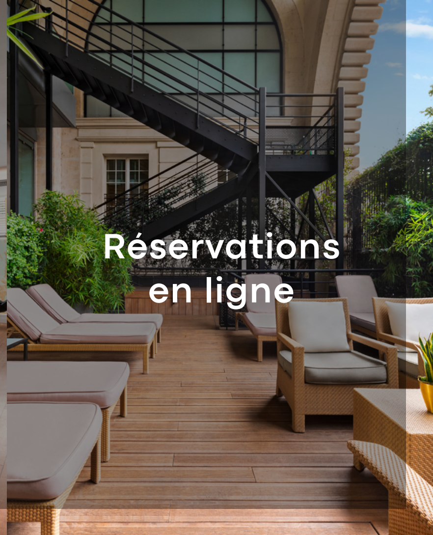
Réservations en ligne