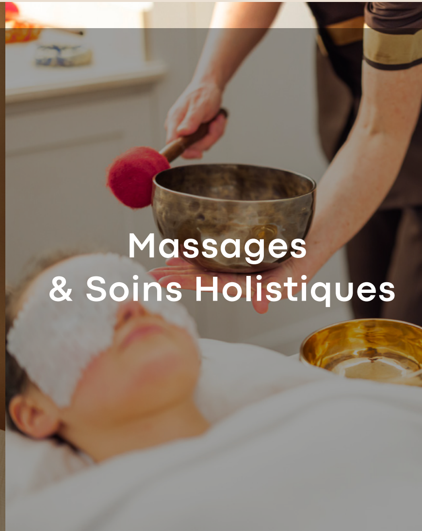
Massages & Soins Holistiques