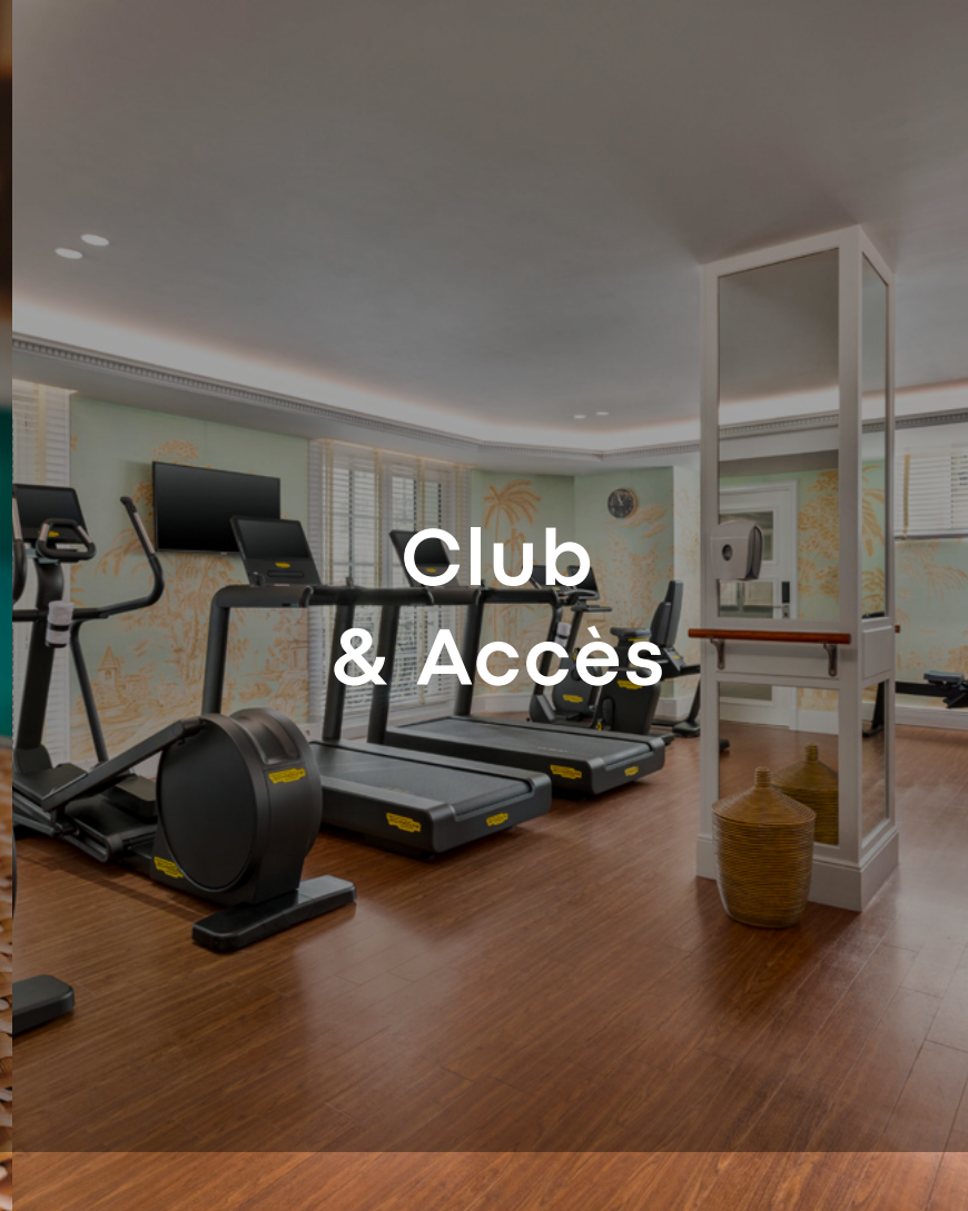
Club & Accès