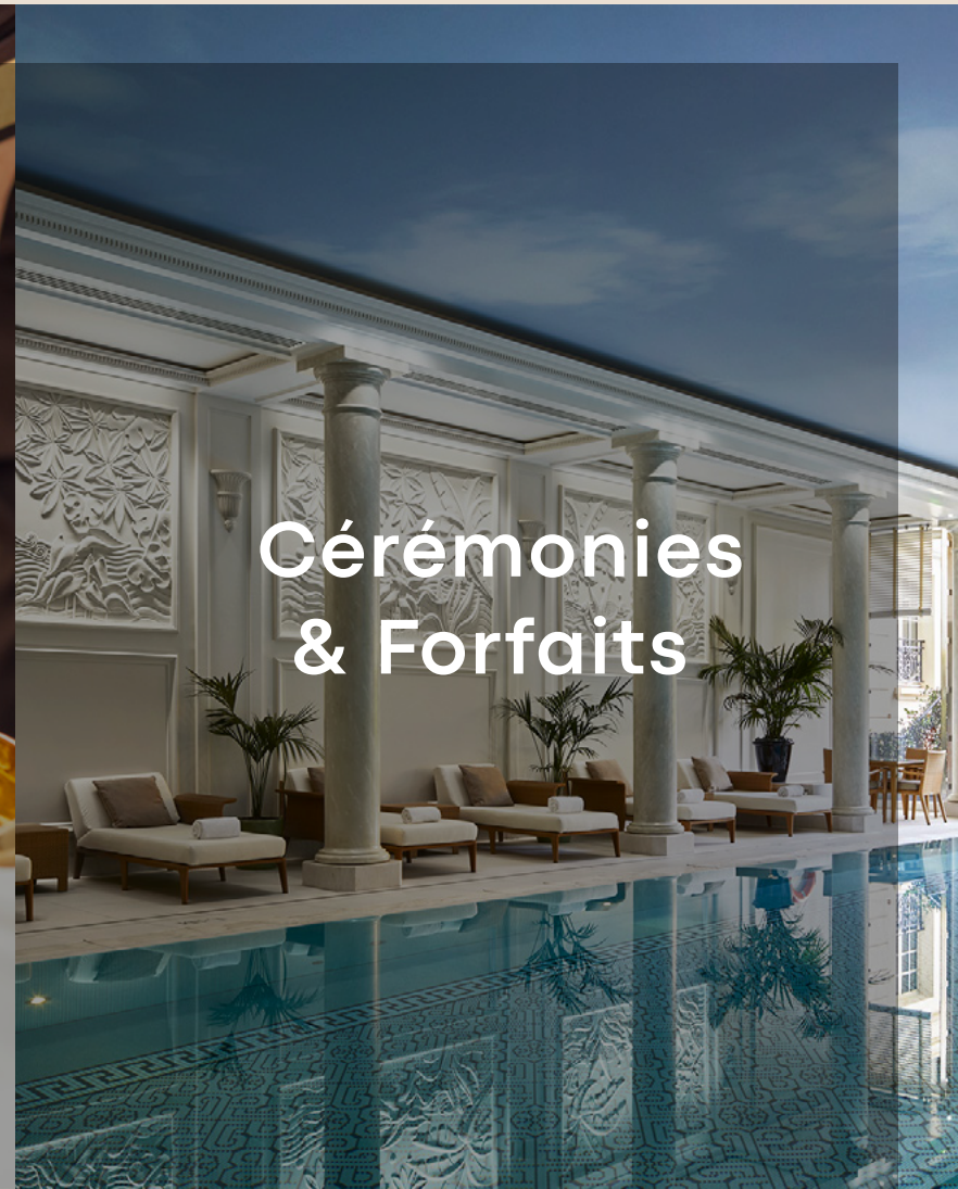
Cérémonies & Forfaits