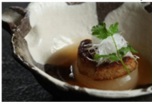
浓汤鹅肝配萝卜 Simmered Foie Gras and Daikon Radish

誠に勝手ながら上価格にサービス料 16%加算させていただきます 以上价格均为人民币，并需加收 10%服务费及在上述价格与服务费总额上计征的政府税及增值税。 All prices are in RMB and are subject to 10% service charge and value-added tax.