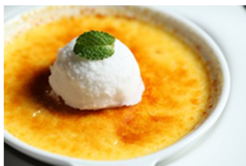
焦烧奶油布丁 Crème Brulee

誠に勝手ながら上価格にサービス料 16%加算させていただきます 以上价格均为人民币, 并需加收 10%服务费及在上述价格与服务费总额上计征的政府税及增值税。 All prices are in RMB and are subject to 10% service charge and value-added tax.