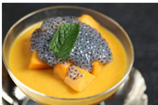
芒果布丁 Mango Pudding