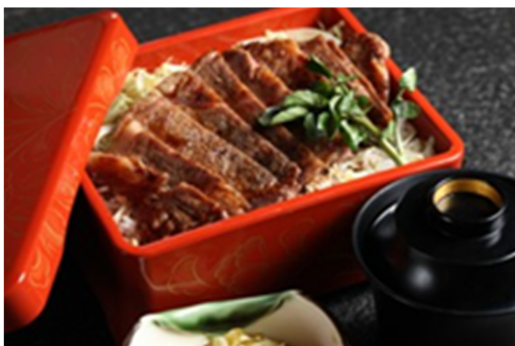
烧肉饭 Barbecued Beef Rice

誠に勝手ながら上価格にサービス料 16%加算させていただきます 以上价格均为人民币, 并需加收 10%服务费及在上述价格与服务费总额上计征的政府税及增值税。 All prices are in RMB and are subject to 10% service charge and value-added tax.