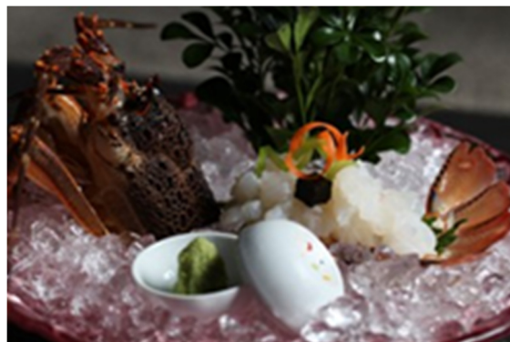
生龙虾 Live Lobster

誠に勝手ながら上価格にサービス料 16%加算させていただきます 以上价格均为人民币，并需加收 10%服务费及在上述价格与服务费总额上计征的政府税及增值税。 All prices are in RMB and are subject to 10% service charge and value-added tax.