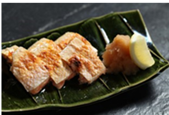
脆烧三文鱼皮 Grilled Crispy Salmon Belly