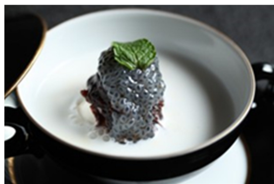
香草冰淇淋扣椰奶 Vanilla Ice-cream with Coconut Milk