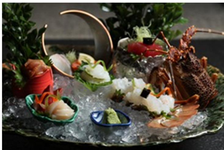
特选什锦生鱼片 Deluxe Assorted Sashimi

誠に勝手ながら上価格にサービス料 16%加算させていただきます 以上价格均为人民币，并需加收 10%服务费及在上述价格与服务费总额上计征的政府税及增值税。 All prices are in RMB and are subject to 10% service charge and value-added tax.