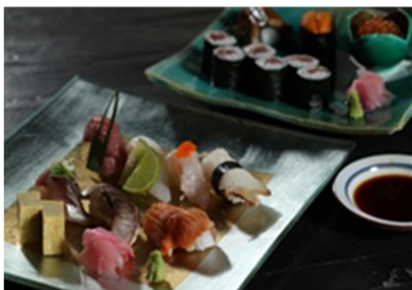
特选什锦寿司特 Deluxe Assorted Sushi (10 pieces)