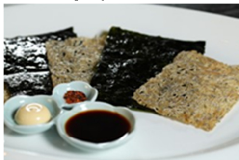
烧干沙丁鱼片 Grilled Sardine in sheet

誠に勝手ながら上価格にサービス料 16%加算させていただきます 以上价格均为人民币, 并需加收 10%服务费及在上述价格与服务费总额上计征的政府税及增值税。 All prices are in RMB and are subject to 10% service charge and value-added tax.