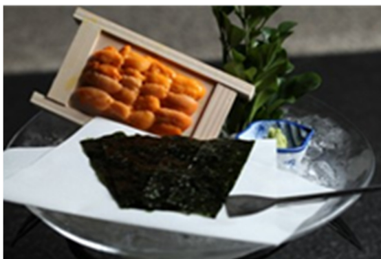
海胆 Sea Urchin