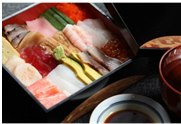
选什锦寿司并 Assorted Sashimi Rice

誠に勝手ながら上価格にサービス料 16%加算させていただきます 以上价格均为人民币, 并需加收 10%服务费及在上述价格与服务费总额上计征的政府税及增值税。 All prices are in RMB and are subject to 10% service charge and value-added tax.