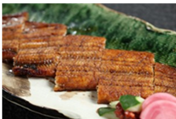
蒲烧鳗鱼 Barbecued Eel