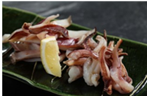
酱烤鱿鱼 Grilled Squid