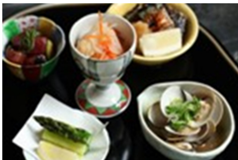
怀石风开胃菜拼盘 Assorted Appetizer