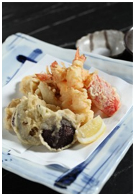
什锦天妇罗 Assorted Tempura