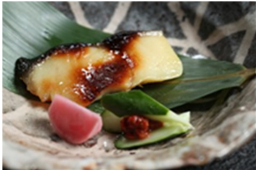
西京烧白身鱼 Grilled Marinated White Meat Fish