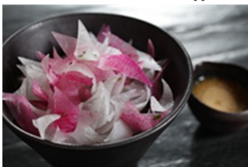
爽脆萝卜片沙拉 Crispy Daikon Radish Salad