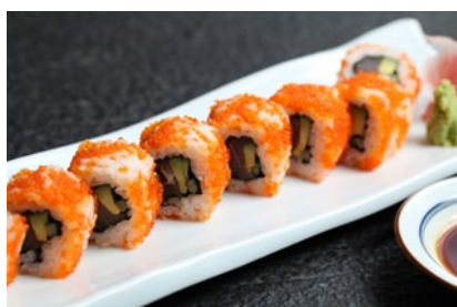
吞拿鱼辣卷 Spicy Tuna Roll