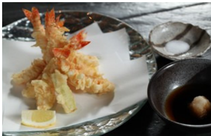
虾天妇罗 Shrimp Tempura

誠に勝手ながら上価格にサービス料 16%加算させていただきます 以上价格均为人民币, 并需加收 10%服务费及在上述价格与服务费总额上计征的政府税及增值税。 All prices are in RMB and are subject to 10% service charge and value-added tax.