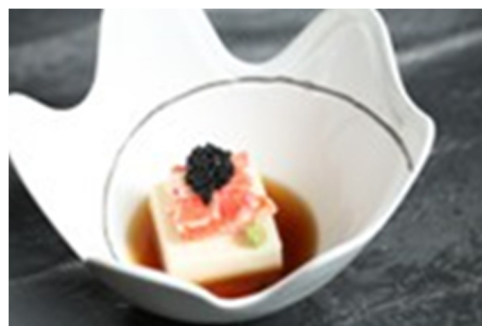
蟹肉鲜芦笋豆腐 Asparagus Tofu with Crabmeat