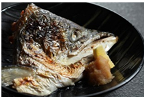
烧三文鱼头 Grilled Salmon Fish Head