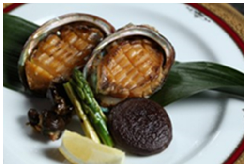
牛油煎鲍鱼 Pan fried slices of Abalone in Butter