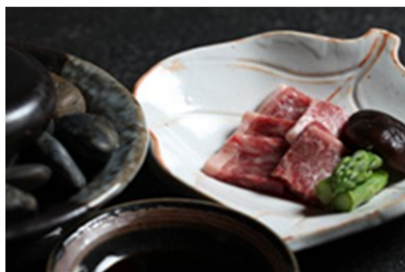
牛肉石板烧 Grilled Beef on Hot Stone

誠に勝手ながら上価格にサービス料 16%加算させていただきます 以上价格均为人民币, 并需加收 10%服务费及在上述价格与服务费总额上计征的政府税及增值税。 All prices are in RMB and are subject to 10% service charge and value-added tax.