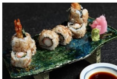
虾天妇罗寿司卷 Sushi Shrimp Tempura Roll