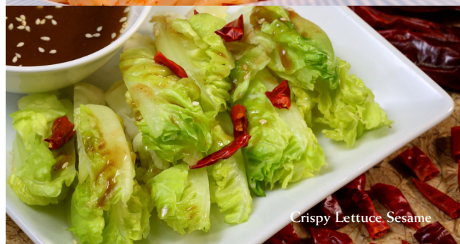
Crispy Lettuce Sesame