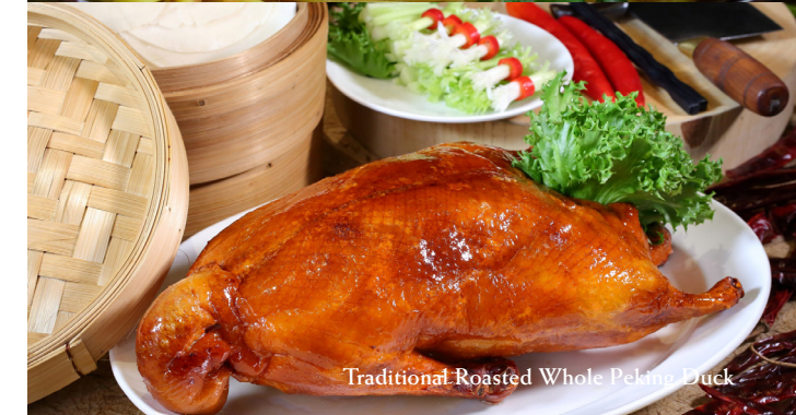
Traditional Roasted Whole Peking Duck