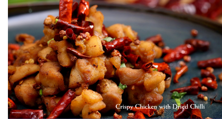
Crispy Chicken with Dried Chilli