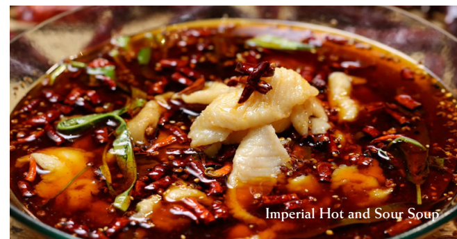
Imperial Hot and Sour Soup