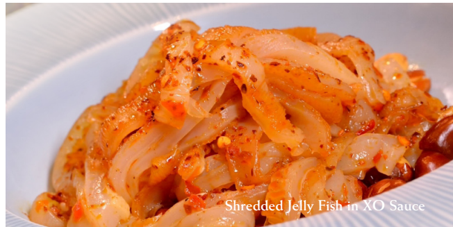
Shredded Jelly Fish in XO Sauce