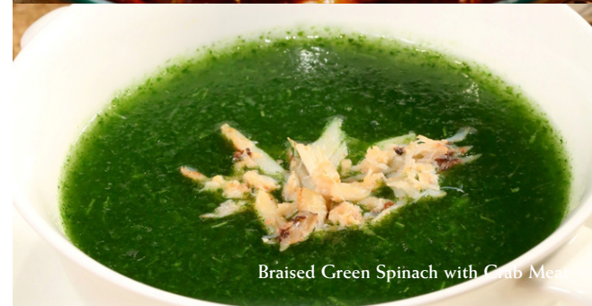
Braised Green Spinach with Crab Meat