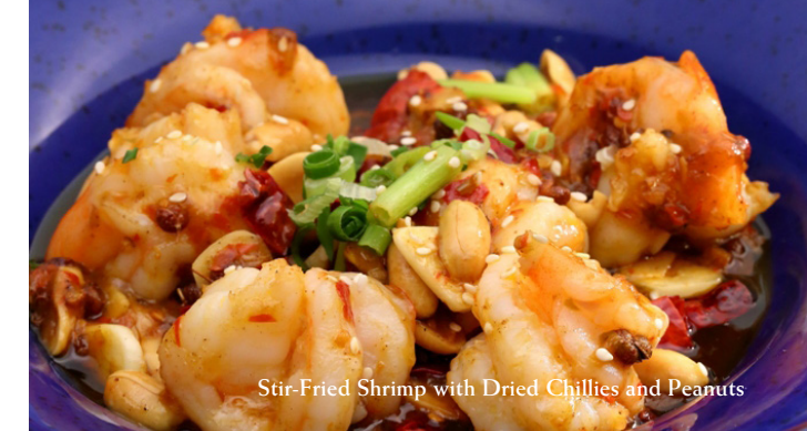
Stir-Fried Shrimp with Dried Chillies and Peanuts