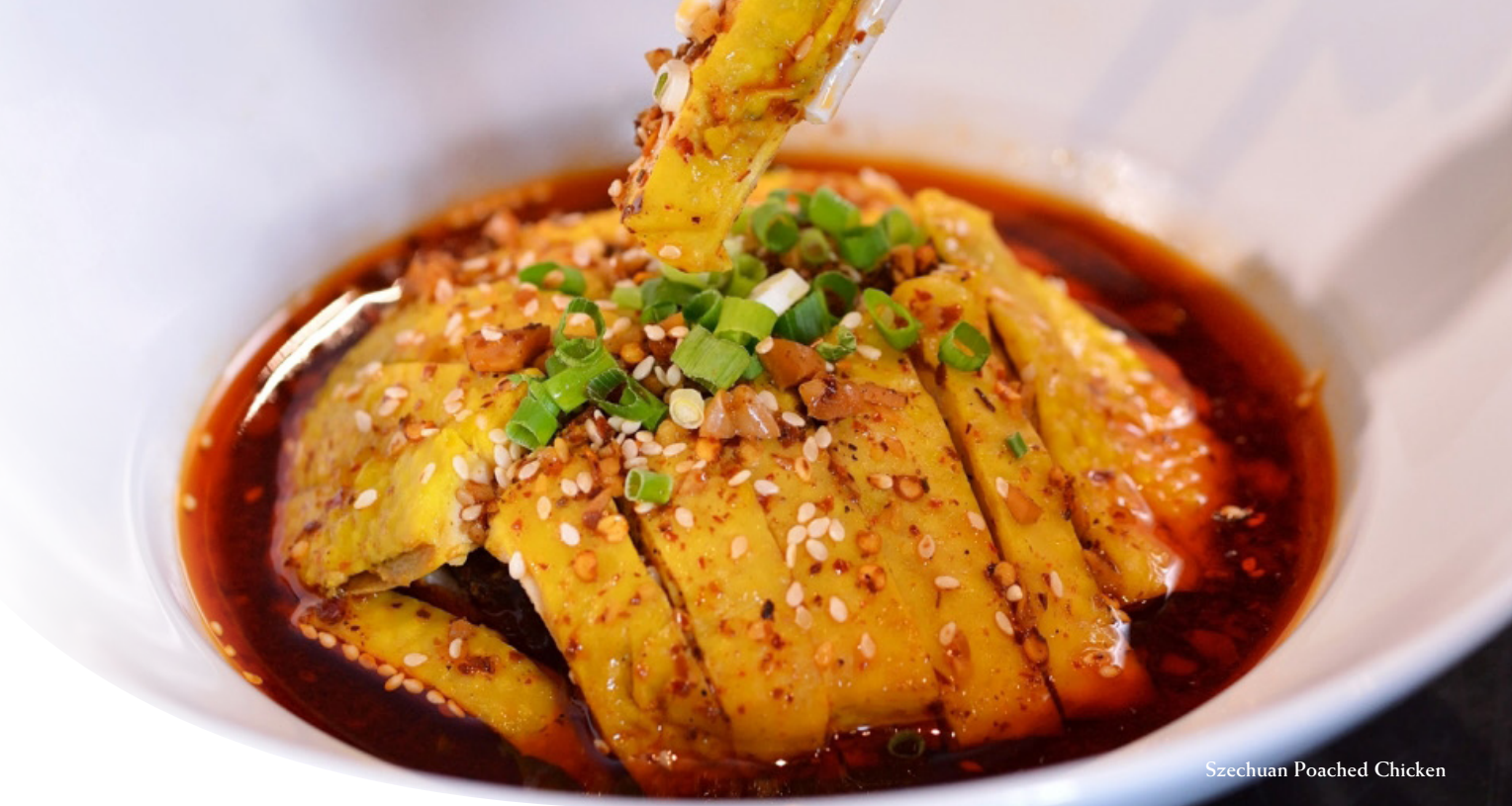
Szechuan Poached Chicken