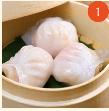
Steamed shrimp dumplings อะเก๋า 晶瑩鮮蝦餃