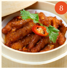
Steamed chicken feet with XO sauce ขาไก่หนึ่ง ซอสเอ็กซ์โอ XOXO 醬蒸鳳爪