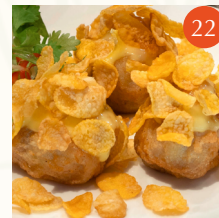
Deep fried chicken ball coated with cornflakes ลูกชิ้นไก่และคอร์นเฟลกทอด 金錢白化球