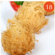
Deep fried mashed taro with shrimp and chicken เผือกทอดไส้กุ้งและไก่สับ 蜂巢炸芋角