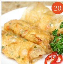
Pan fried shrimps wrapped in bean curd skin ฟองเต้าหู้ไส้กุ้ง 鮮蝦腐皮卷