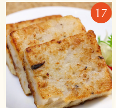
Pan fried turnip cakes ขนมผักกาด 香煎蘿白糕