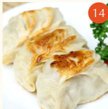
Pan fried pork dumplings เกี๊ยวซ่าหมู 鮮肉煎鍋貼