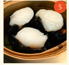
Steamed scallop "Siew Mai" with squid ink ขนมจับหอยเชลล์ 玉帶燒麥皇