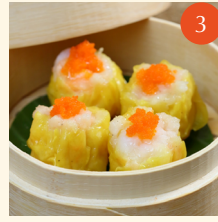
Steamed shrimp "Siew Mai" with crab roe ขนมจับกุ้ง 鮮蝦燒麥