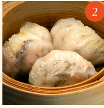
Steamed crystal prawn dumpling with black truffle อะเก๋ากุ้งและเห็ดทรัฟเฟิล 松露黑汁鮮蝦餃