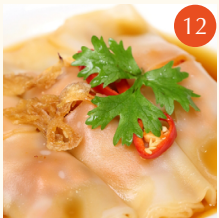
Steamed rice rolls with BBQ pork ก๊วยเตี๋ยวลอดหมูแดง 叉燒腸粉