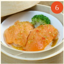
Steamed fish stuffed with minced shrimp เนื้อปลาอัดไส้กุ้ง 魚吃蝦