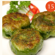
Pan fried green chive pastries ขนมกวยซ่าเจี๋ยน 香煎韭菜餃