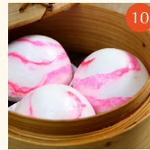
Chinese salted egg custard steamed buns ซาลาเปาไส้ไข่ 流沙奶黃包