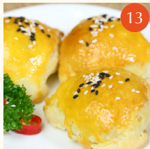
Baked barbecued pork pastries พายหมูแดงอบ 焗叉燒酥