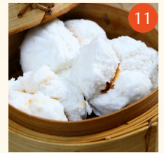
Steamed BBQ pork buns ซาลาเปาไส้หมูแดง 蠔皇叉燒包