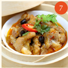
Steamed spare ribs with garlic ซี่โครงหมูหนึ่งกระเทียม 金蒜蒸排骨