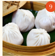
Steamed pork dumplings เสี่ยวหลงเป่า 灌湯小籠包