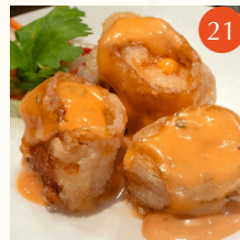
Scallop wrapped in bacon with thousand island dressing หอยเชลล์พันเบคอนทอด ราดน้ำสลัดเทาซันด์ 香煎培根帶子卷