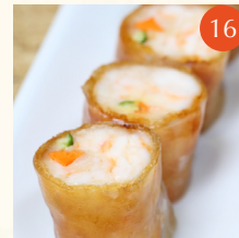
Steamed crispy rice rolls with shrimps ก๊วยเตี๋ยวลอดไส้โป๊เปี้ยะกุ้ง 脆皮鮮蝦腸粉