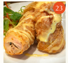
Crispy bean curd skin with chicken and foie gras ฟองเต้าหู้ไส้ไก่และฟัวกราส์ทอด 鵝肝腐皮卷