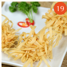
Crispy squid balls with sweet and sour sauce ลูกชิ้นปลาหมึกทอด 龍鬚墨魚球