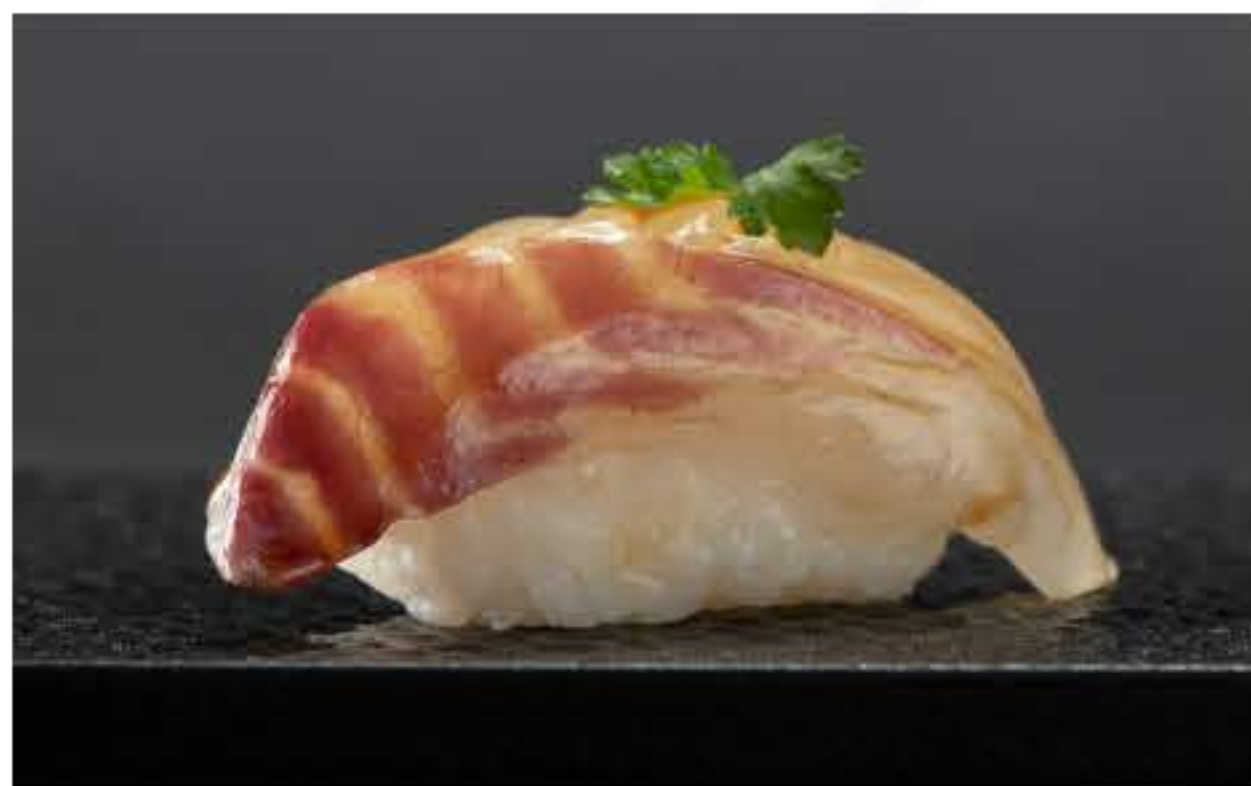
Snapper Nigiri 鲷鱼握寿司