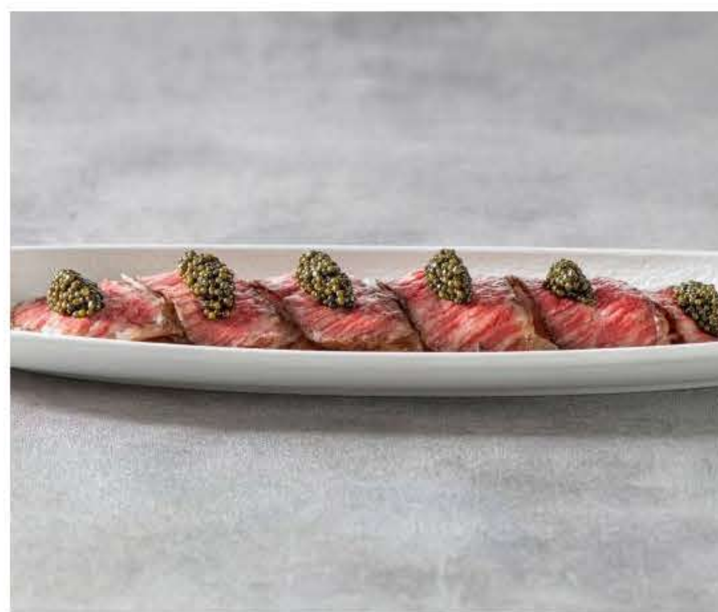
Roasted Wagyu Beef Salad with Caviar 烤和牛沙拉配鱼子酱