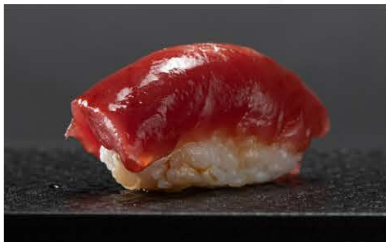
Akami Nigiri 金枪鱼握寿司