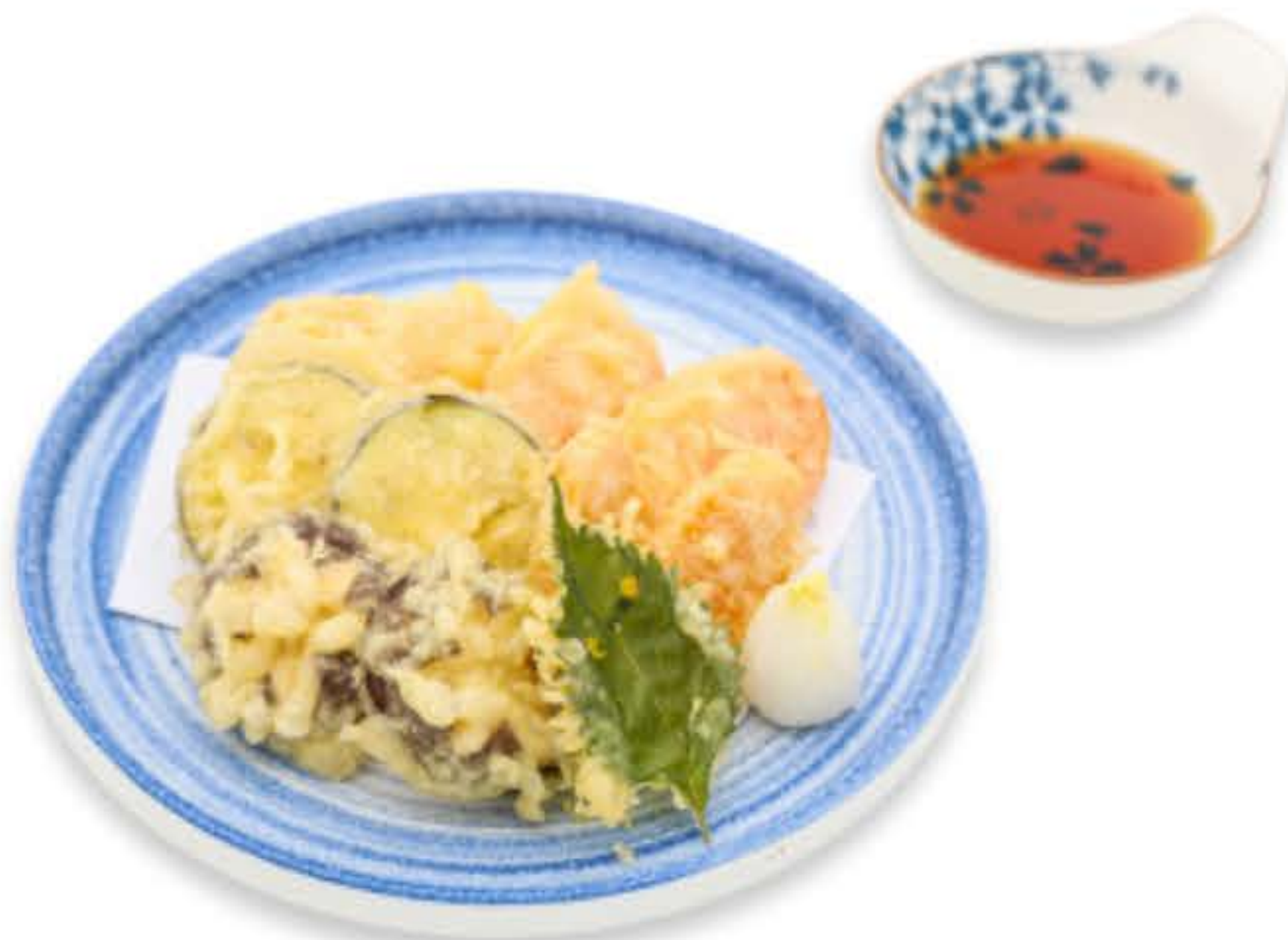
Vegetable Tempura 蔬菜天妇罗