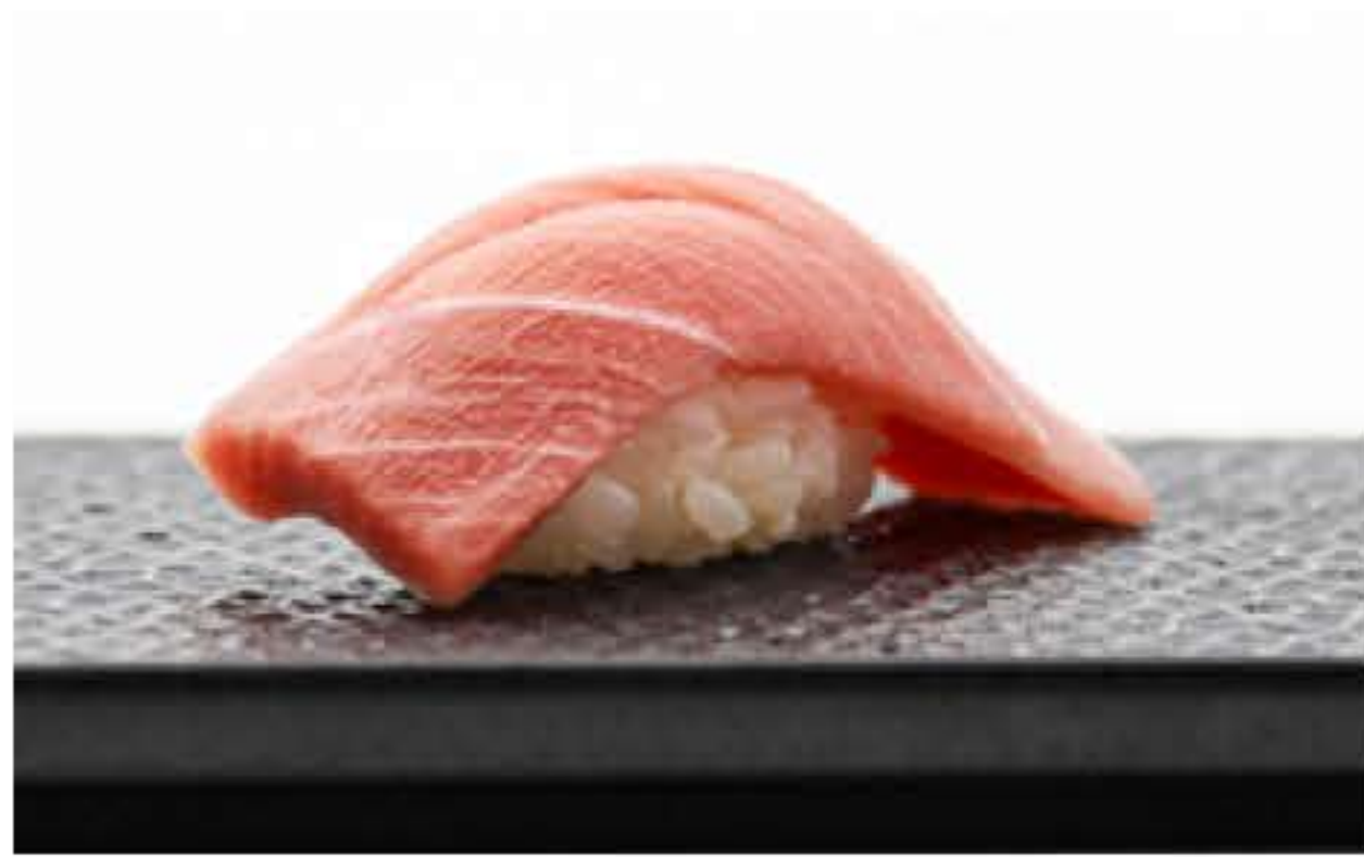
Chu-toro Nigiri 金枪鱼中腹握寿司