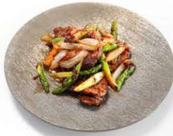
Pork Chops with BBQ Sauce 煎豚里脊佐烧烤酱