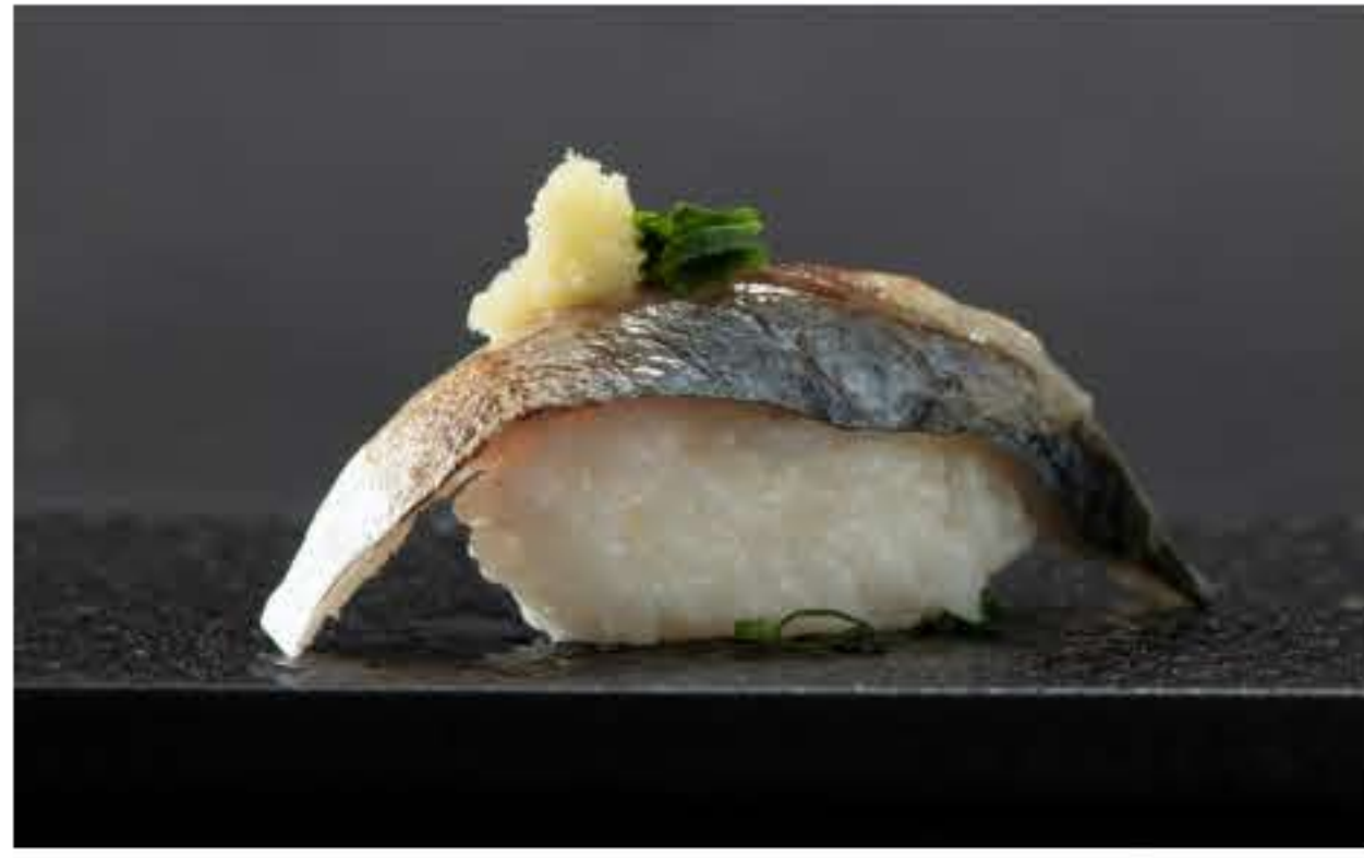
Mackerel Nigiri 醋渍鲭鱼寿司