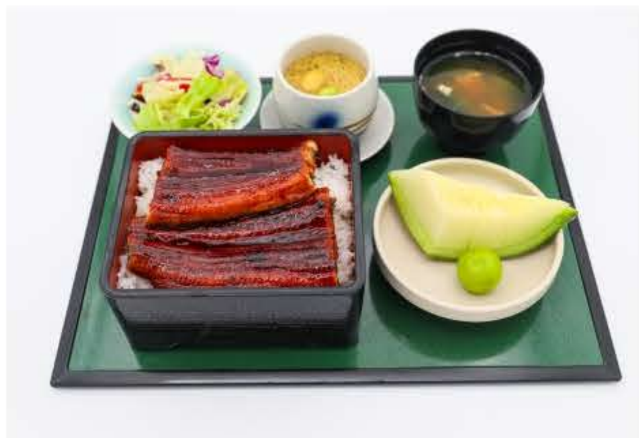
Grilled Eel On Steamed Rice 蒲烧鳗鱼定食