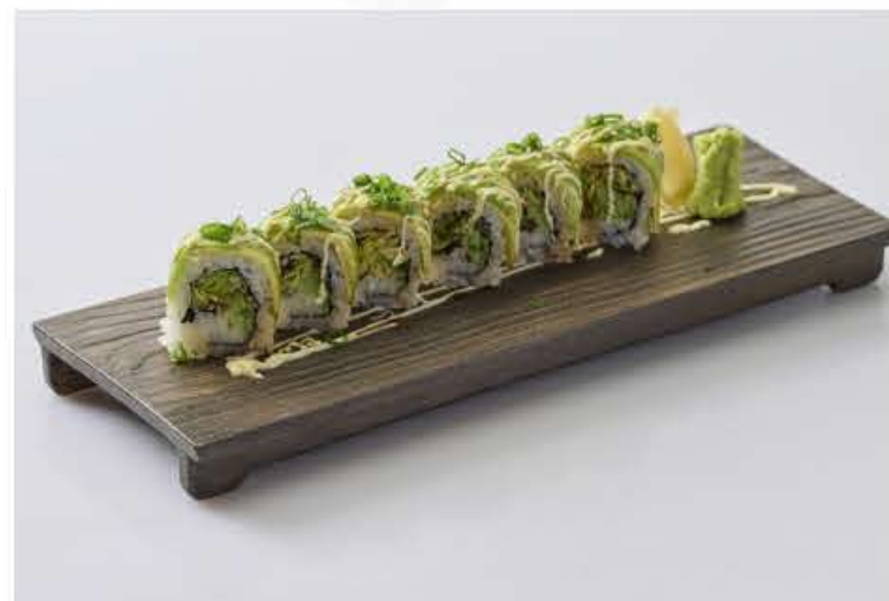
Avocado Caterpillar Maki 鳄梨时蔬寿司卷