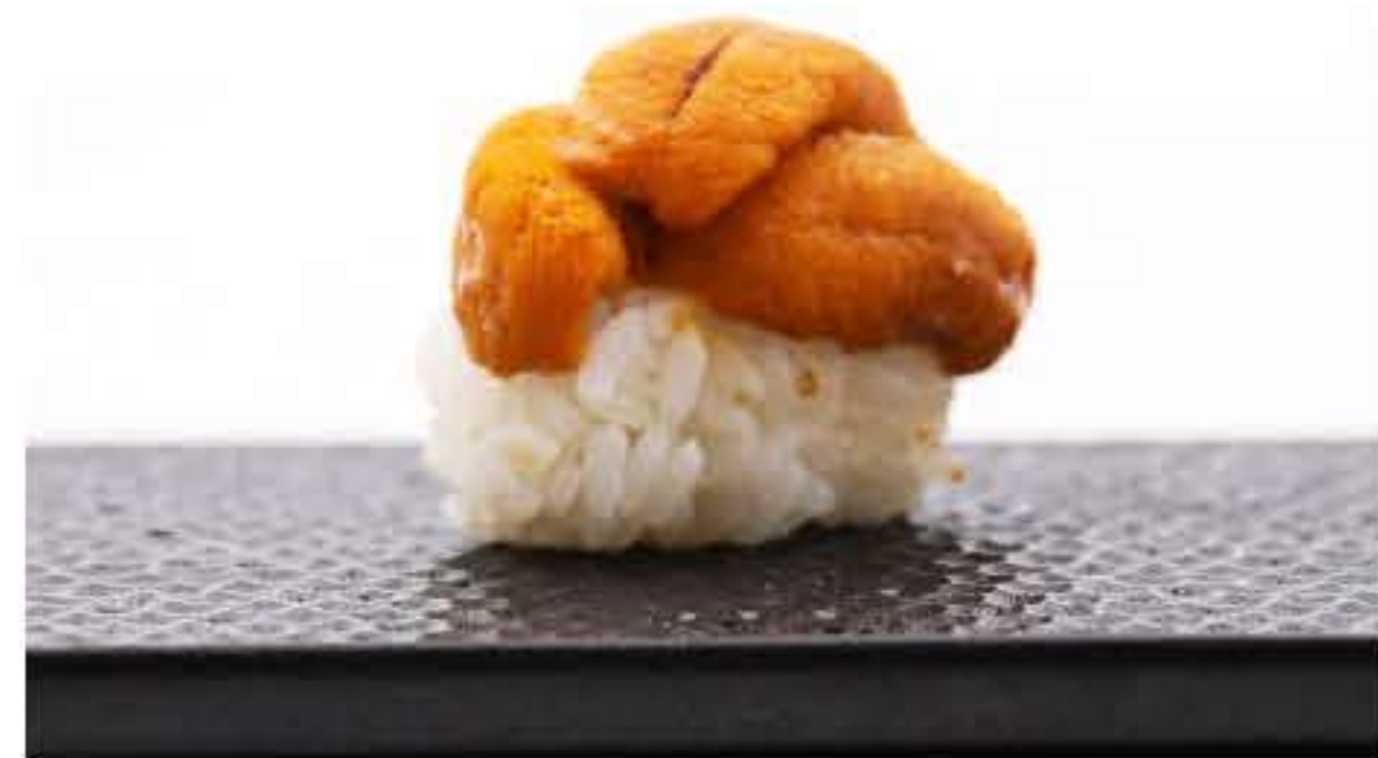
Sea Urchin Nigiri 海胆寿司