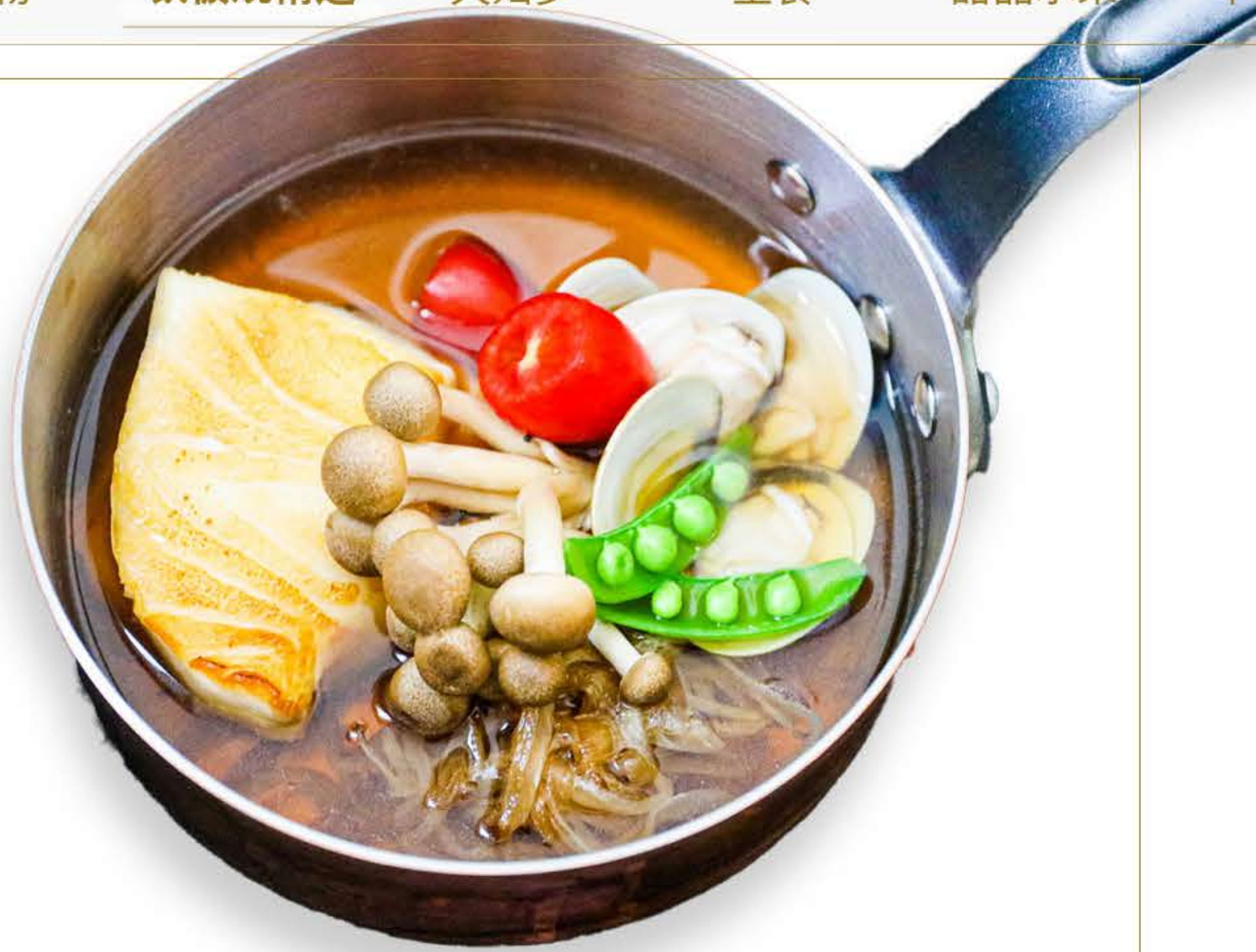
Silver Cod in Soup 洋葱清汤银鳕鱼