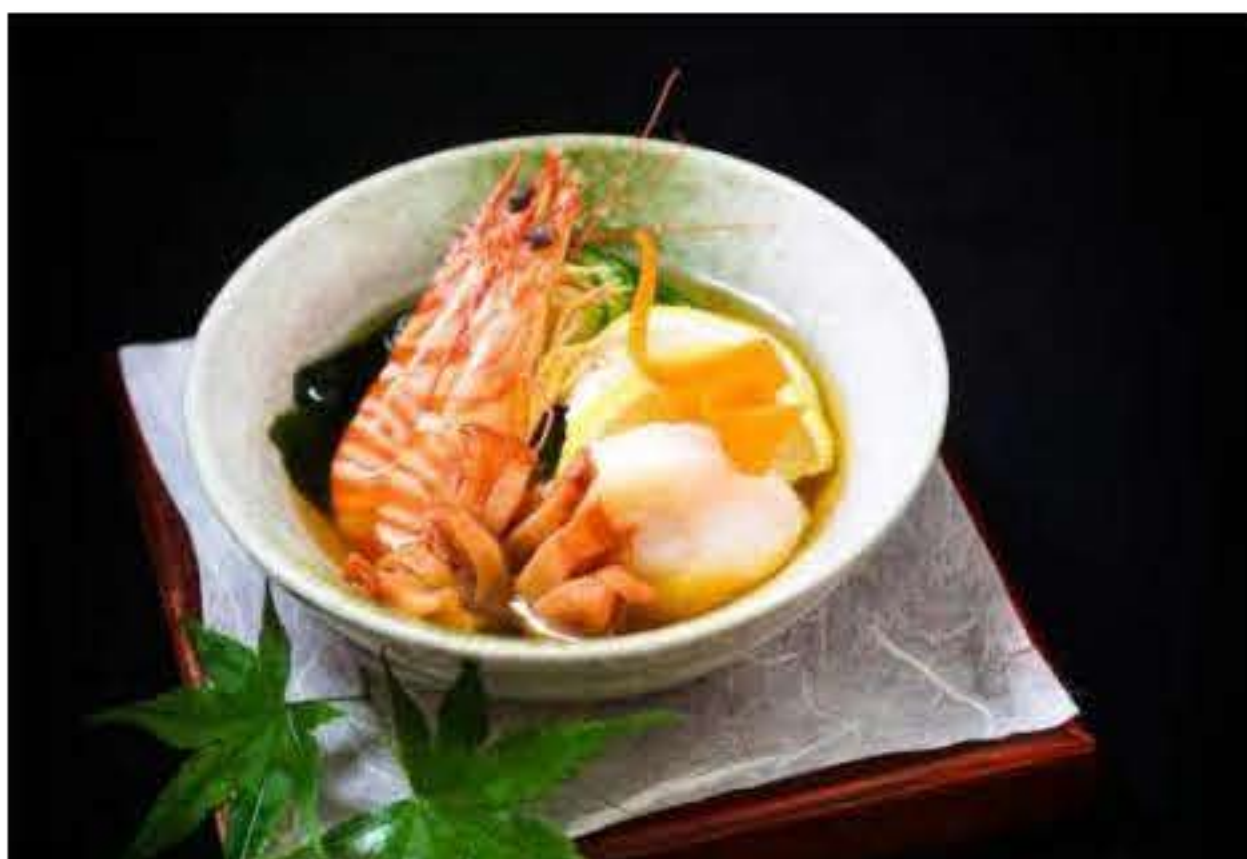
Seafood and Seaweed in Vinegar 海鲜醋物