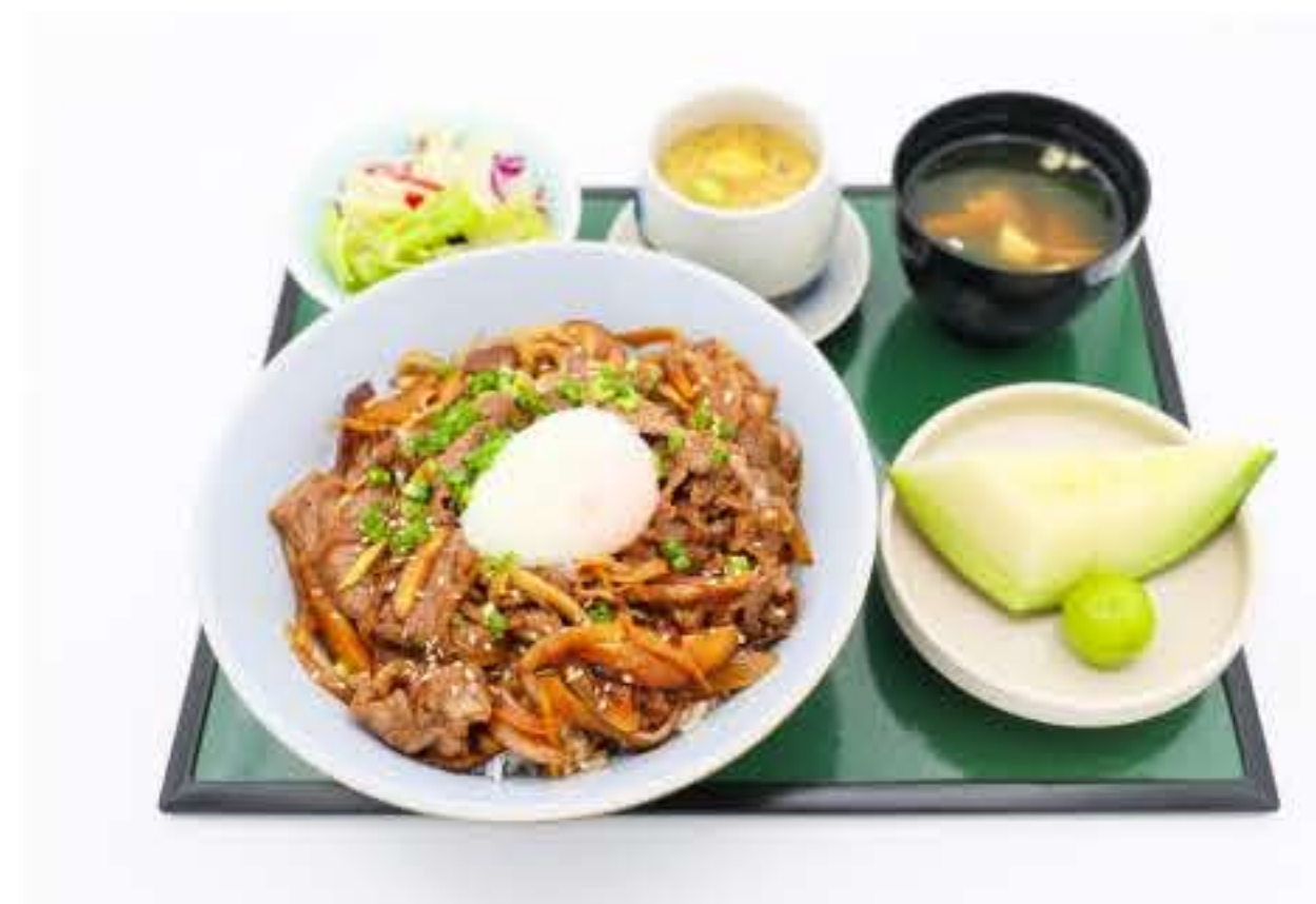
Stir Fried Fliced Beef Over Rice Set 温泉蛋牛肉饭定食