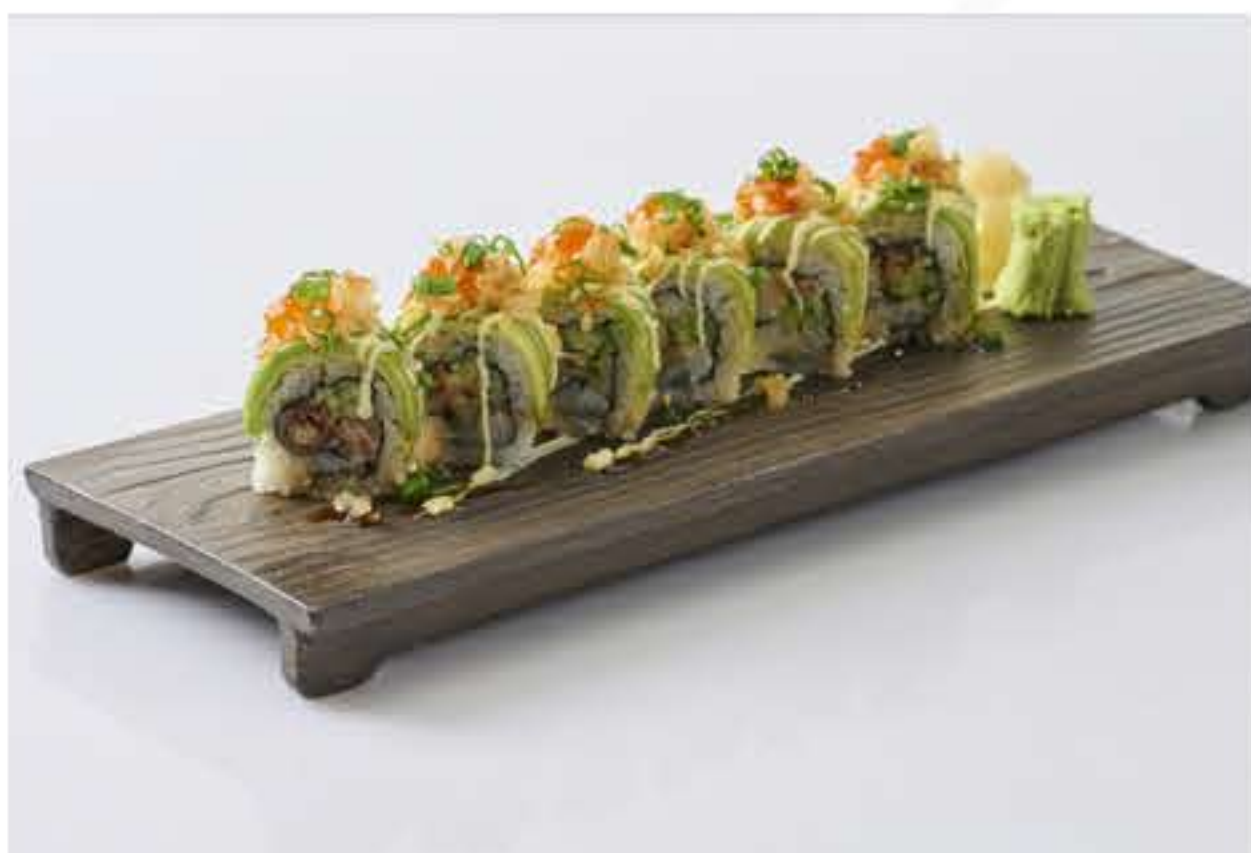
Soft Shell Crab Roll Maki 软壳蟹卷