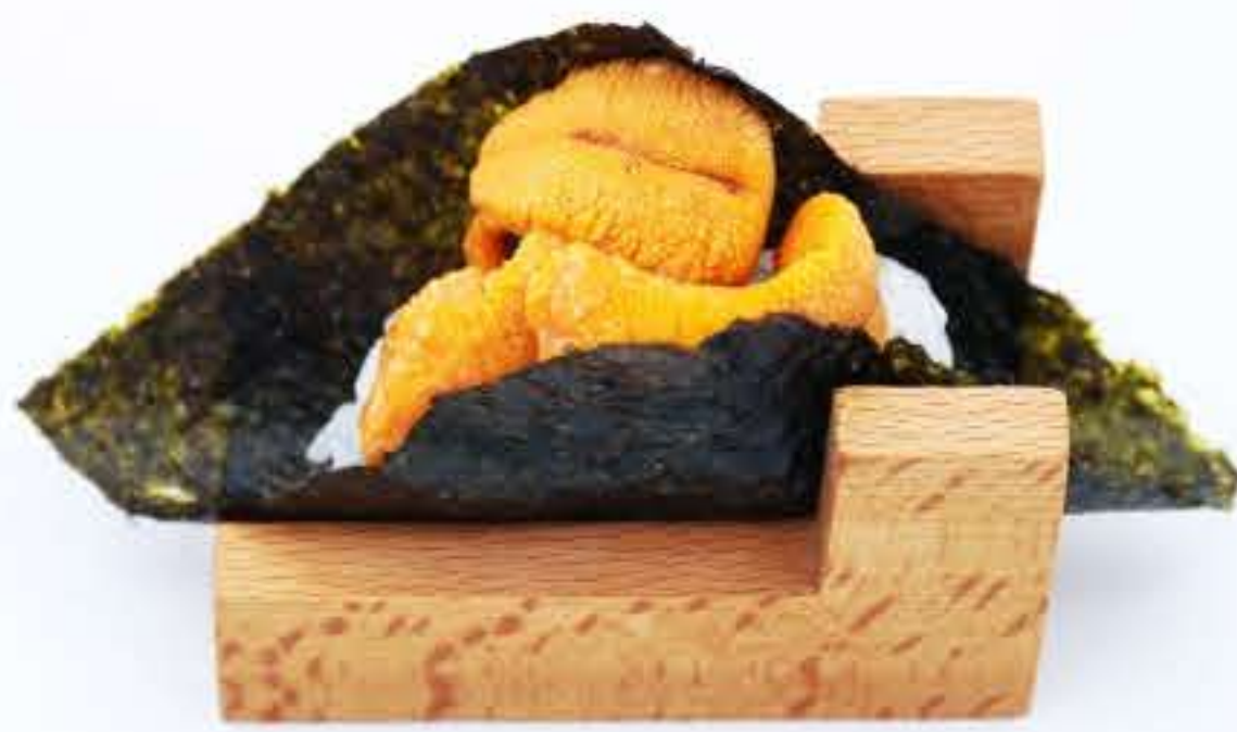
Uni Temaki 海胆手卷