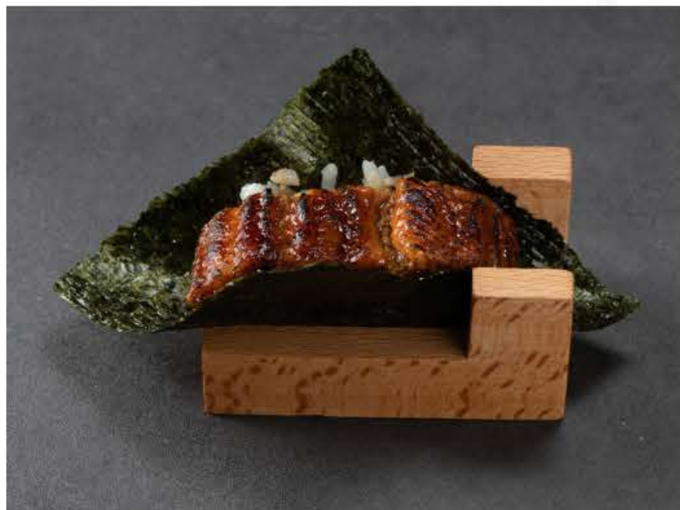
Unagi Temaki 鳗鱼蒲烧手卷