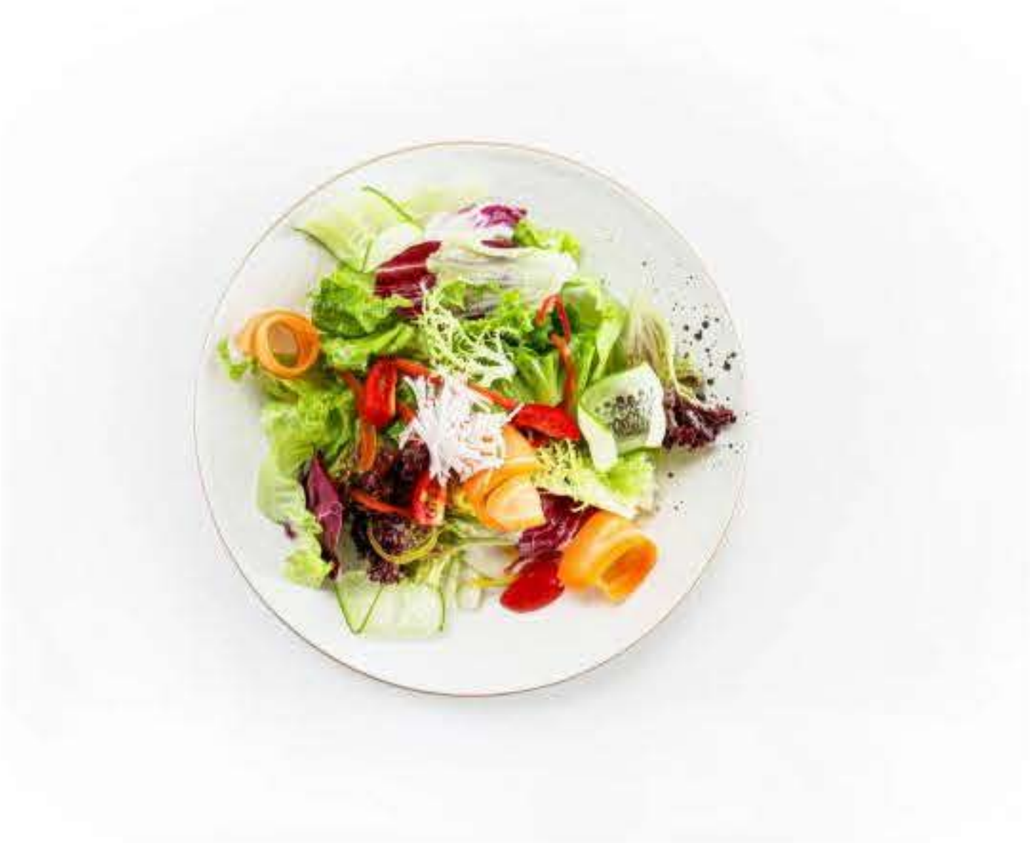
Assorted Vegetables with Signature Vinaigrette 西村沙拉