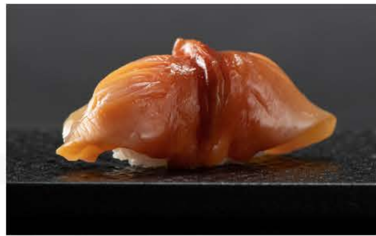
Arkshell Nigiri 赤贝寿司