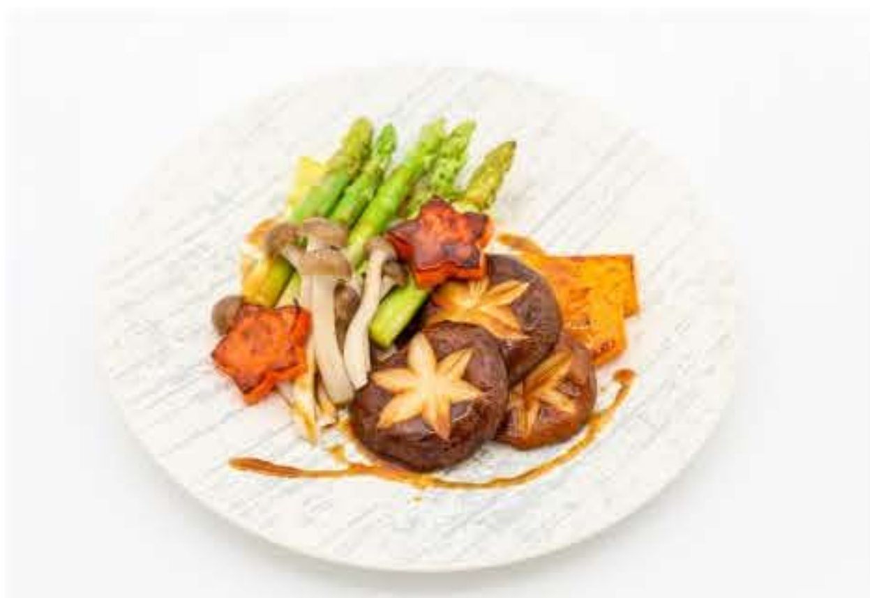
Asparagus and Mushroom Teppanyaki 铁板香菇芦笋