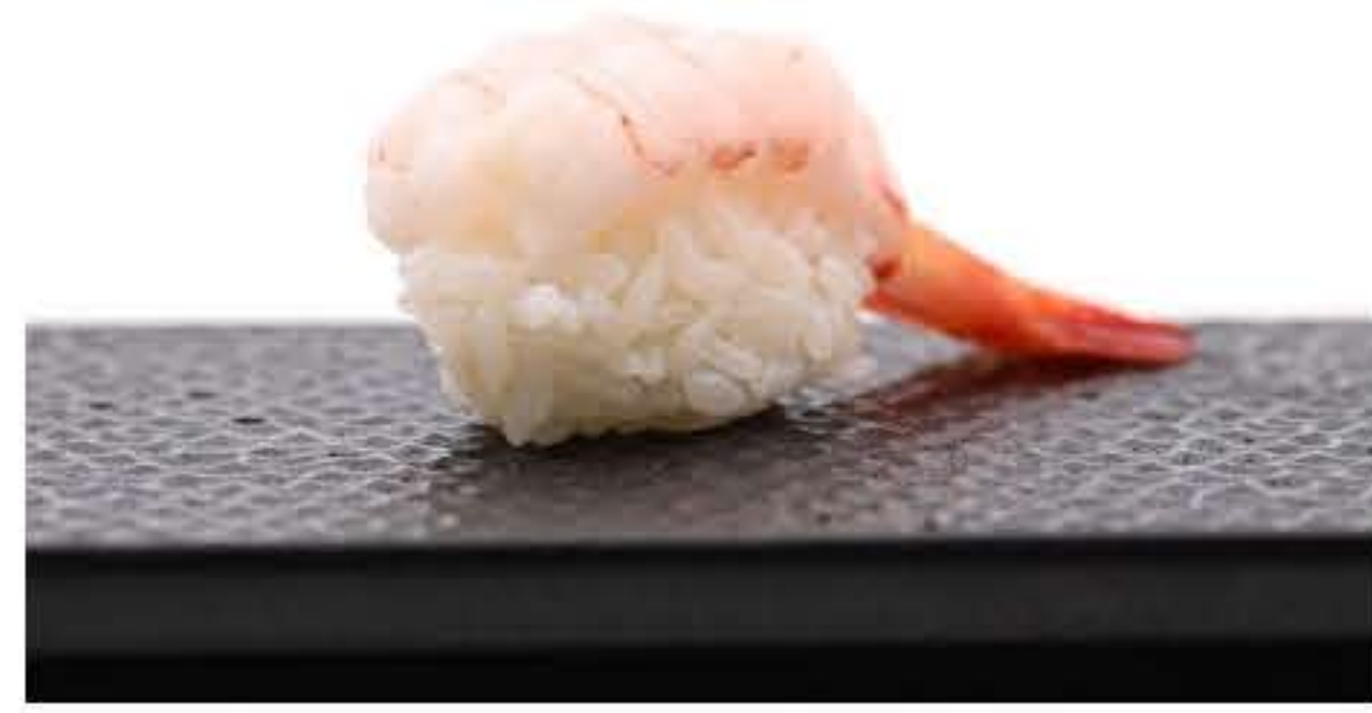
Sweet Shrimp Nigiri 甜虾握寿司