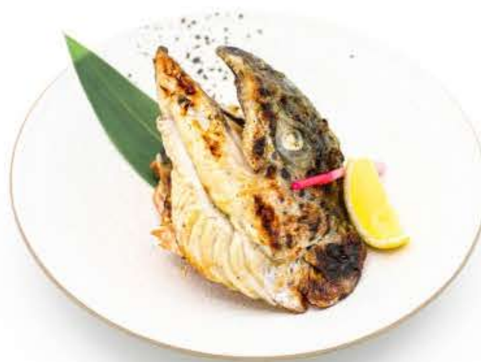
Salmon Head with Sea Salt 三文鱼头