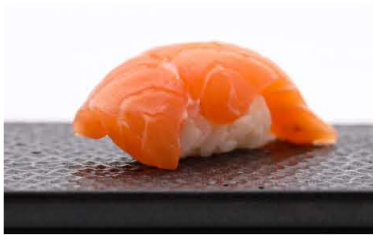
Salmon Nigiri 三文鱼握寿司