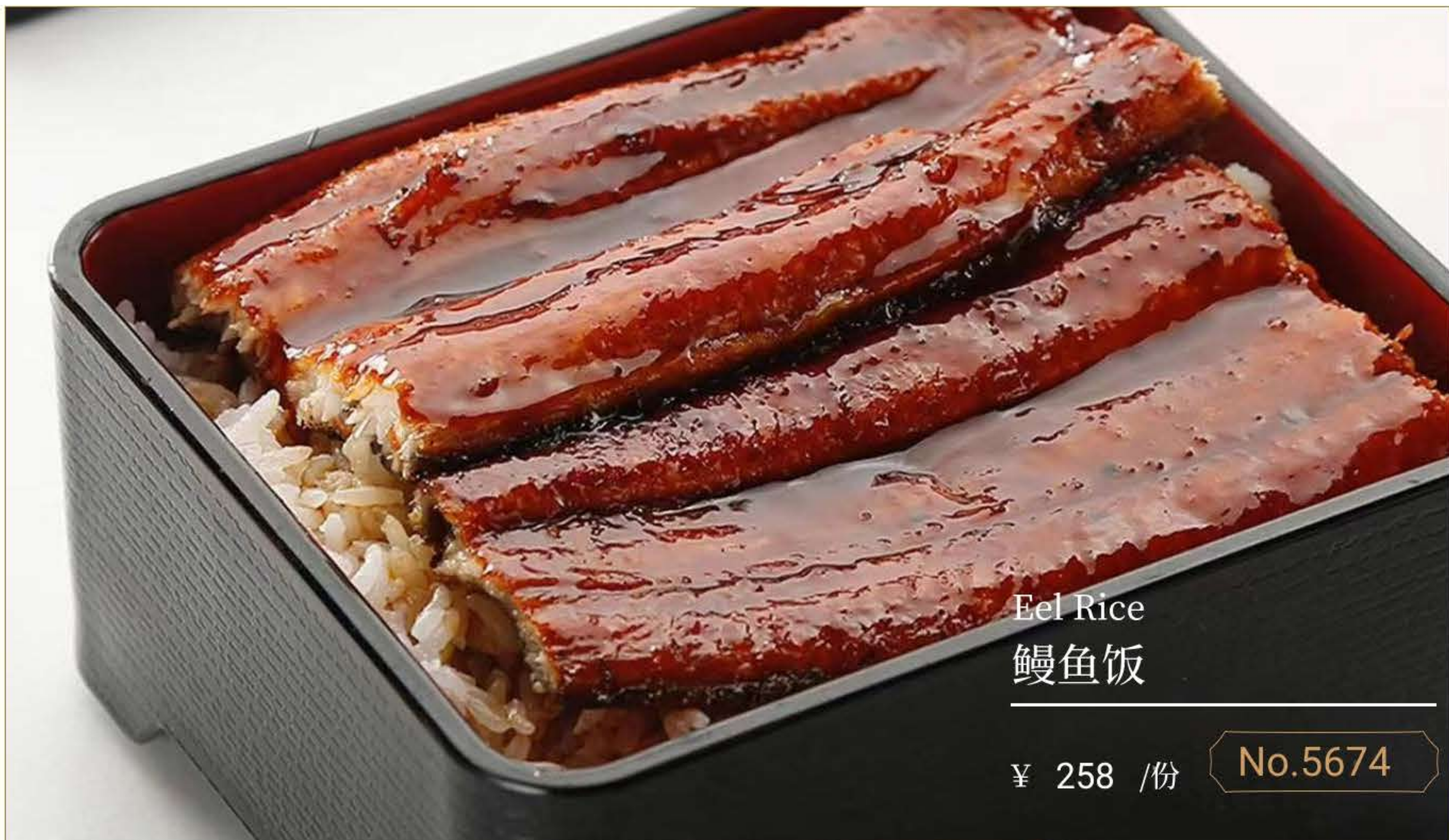
Eel Rice 鳗鱼饭