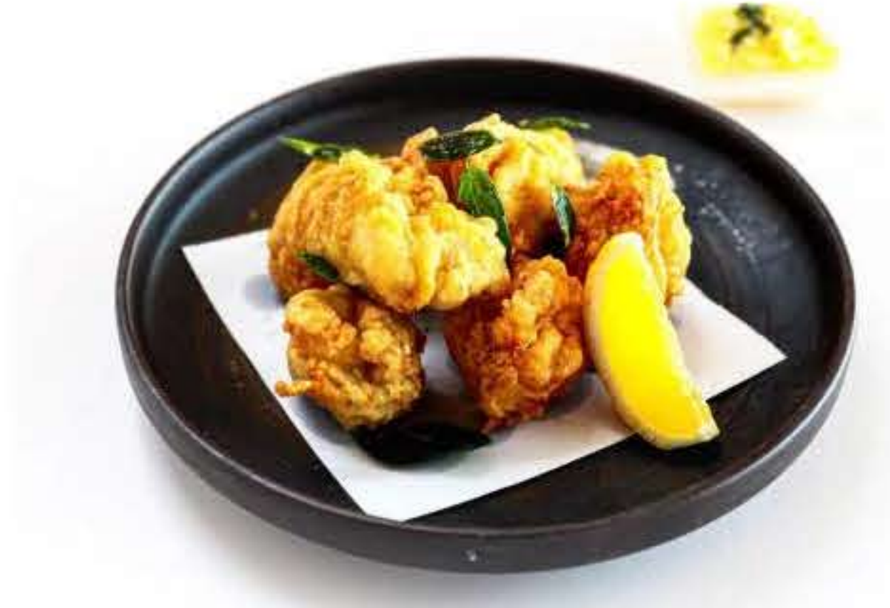
Deep Fried Chicken with Tartar Sauce 炸鸡块塔塔酱