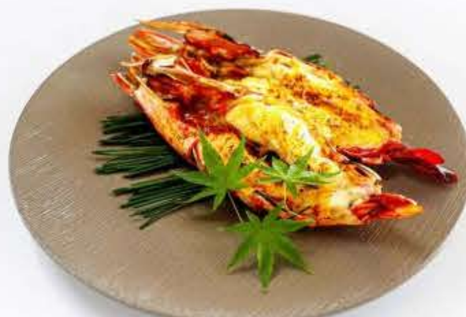
Tiger Prawn 虎虾山椒柚子烧