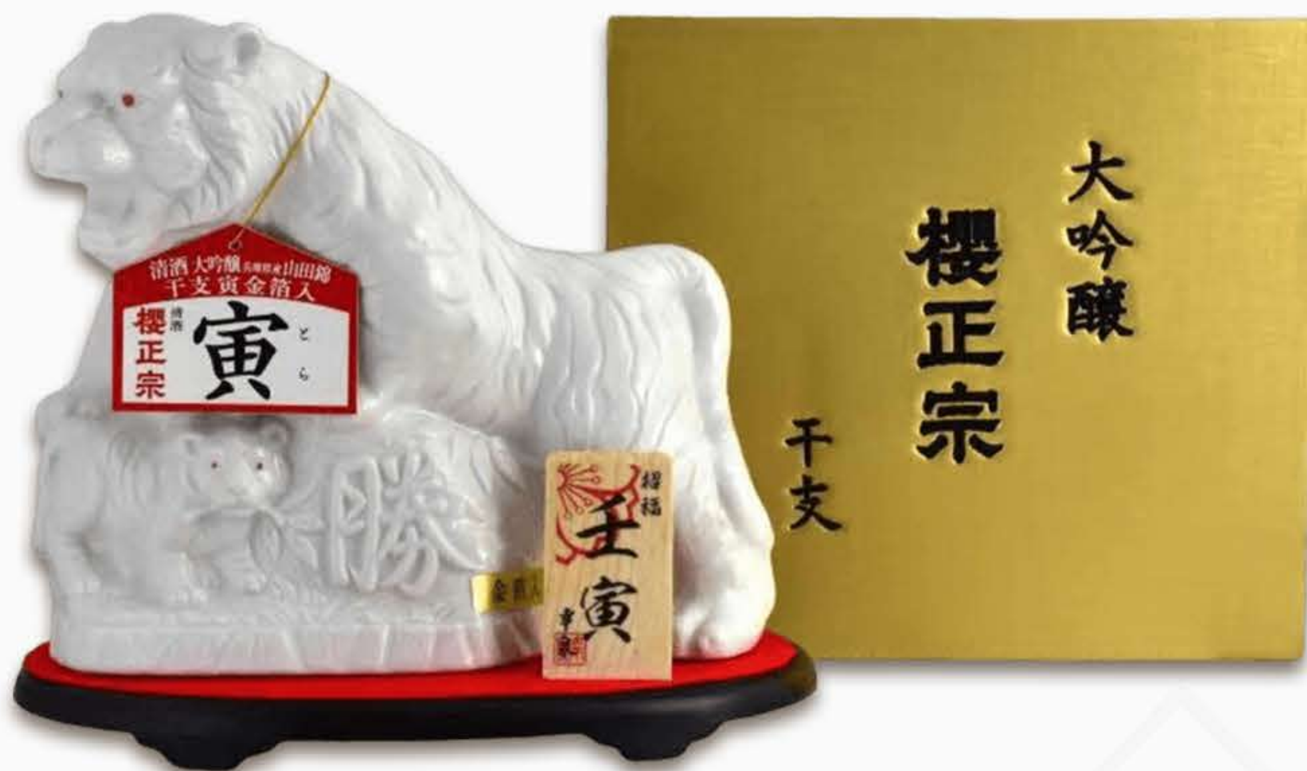
Sakuramasamune Zodiac Bottle Daiginjo 720ML 櫻正宗生肖瓶大吟醸720毫升