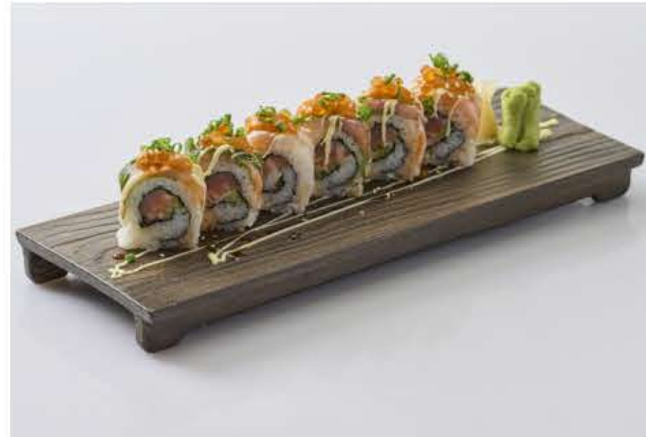
Seafood Rainbow Maki 海鲜彩虹卷