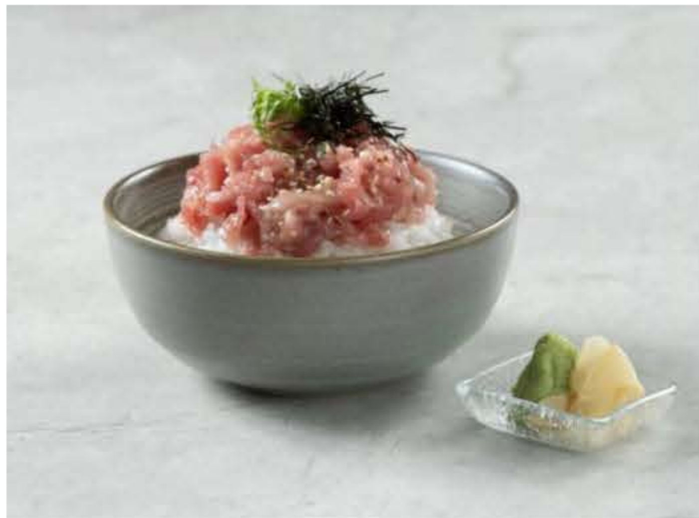
Nakauchi Chirashi 金枪鱼碎海鲜饭