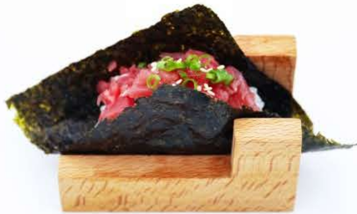
Negi Toro Temaki 葱金枪鱼腩手卷