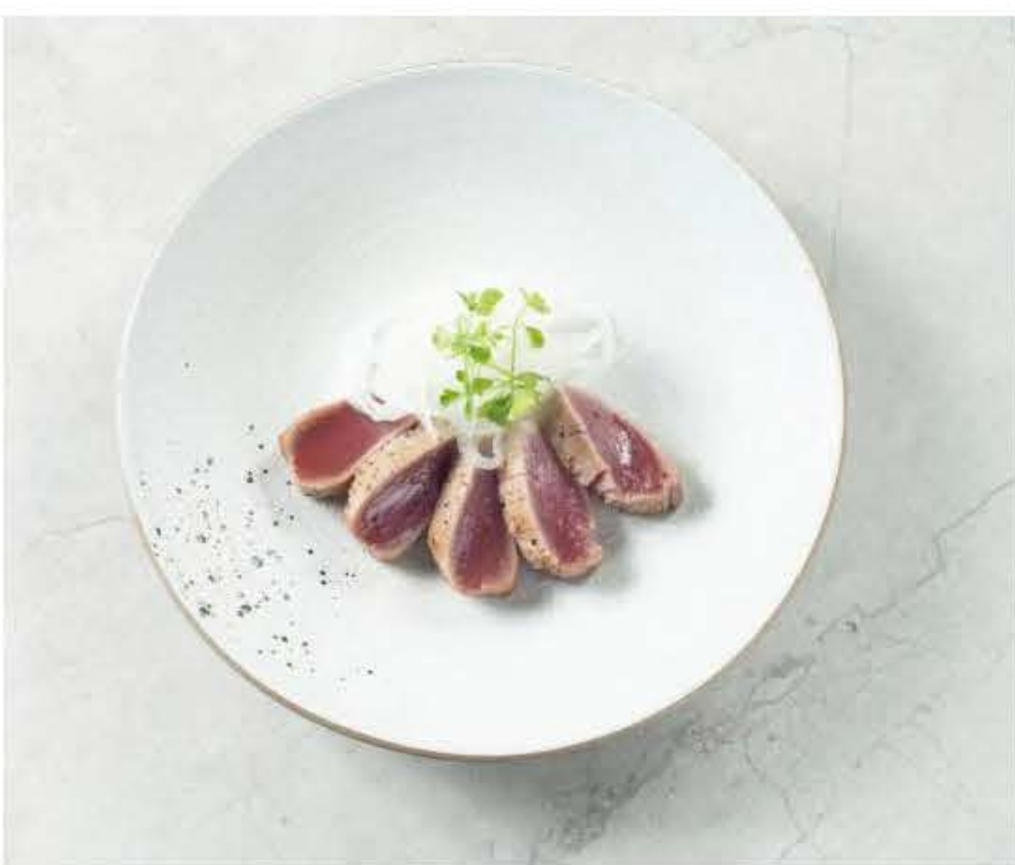
Tuna Akami Tataki Salad 炙烧金枪鱼沙拉