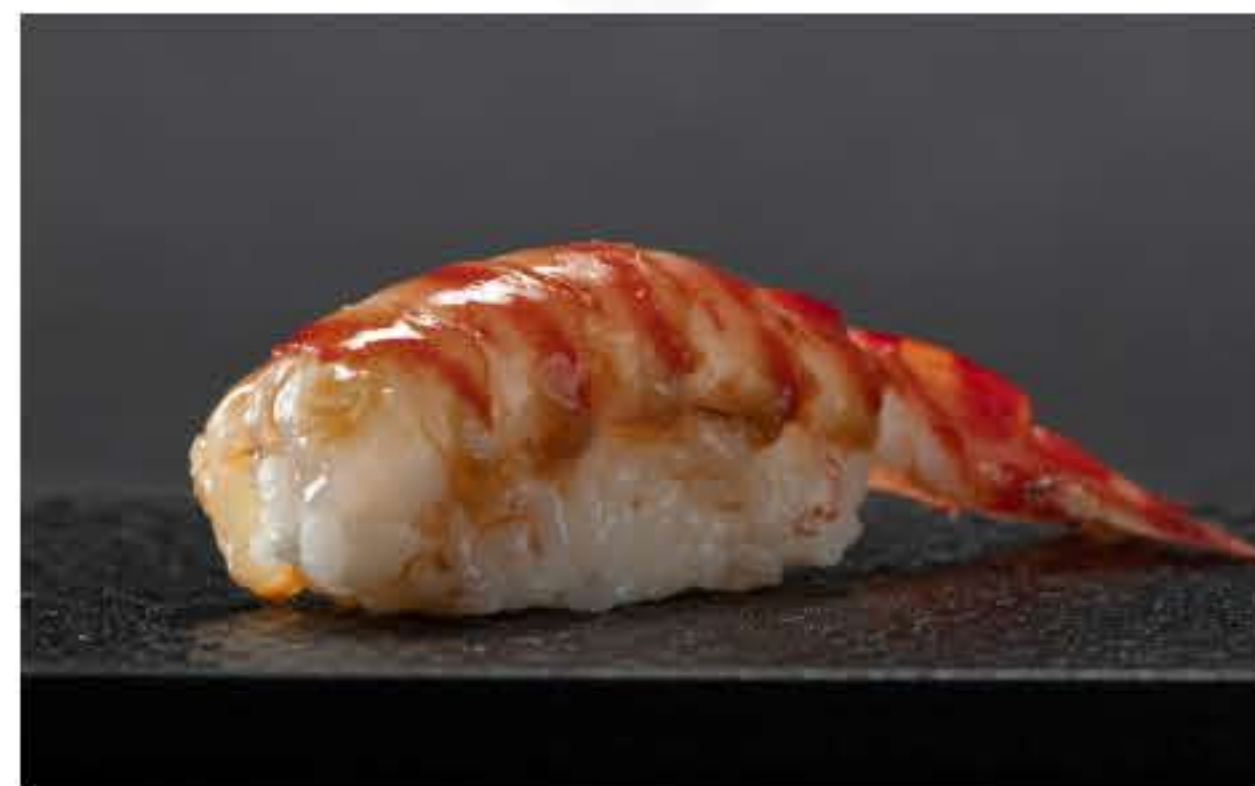
Flower Prawn Nigiri 斑节虾握寿司