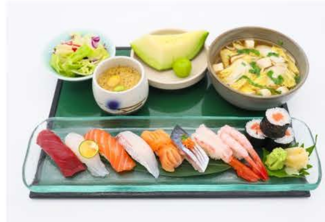
Sushi Combination Set 西村什锦寿司定食