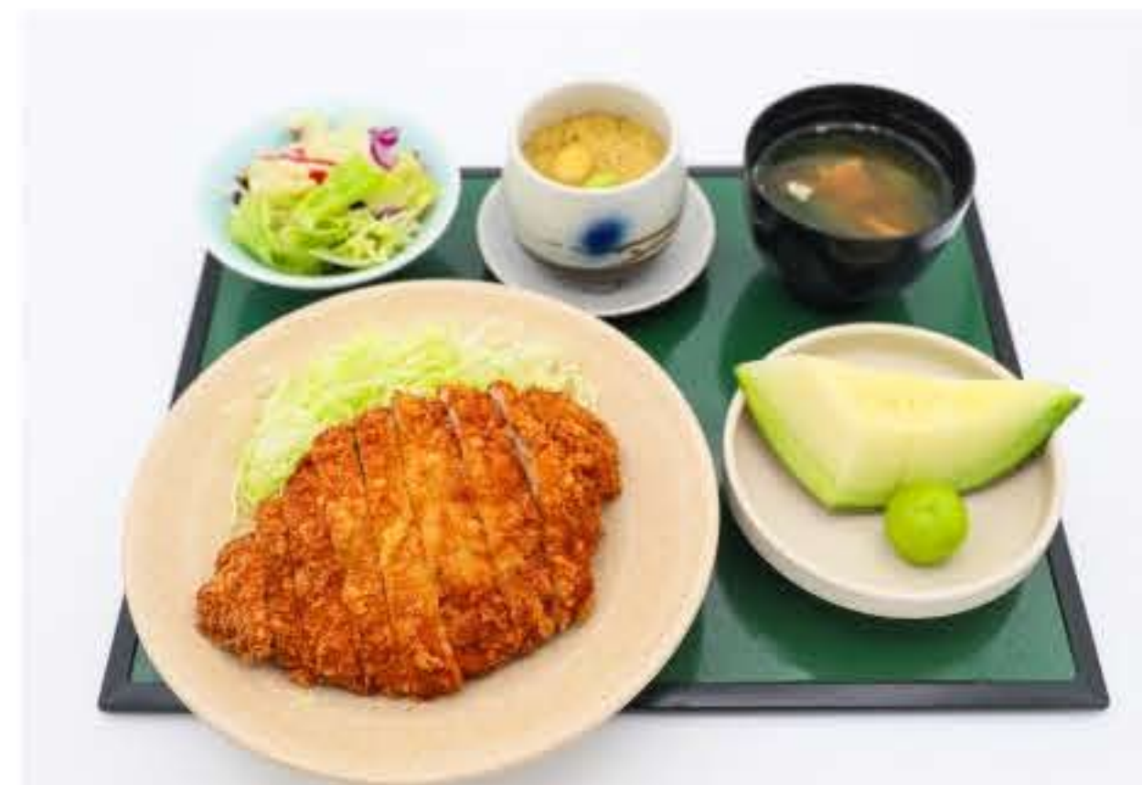
Jumbo Iberico Pork Cutlet Bowl Set 厚切吉列猪排饭定食