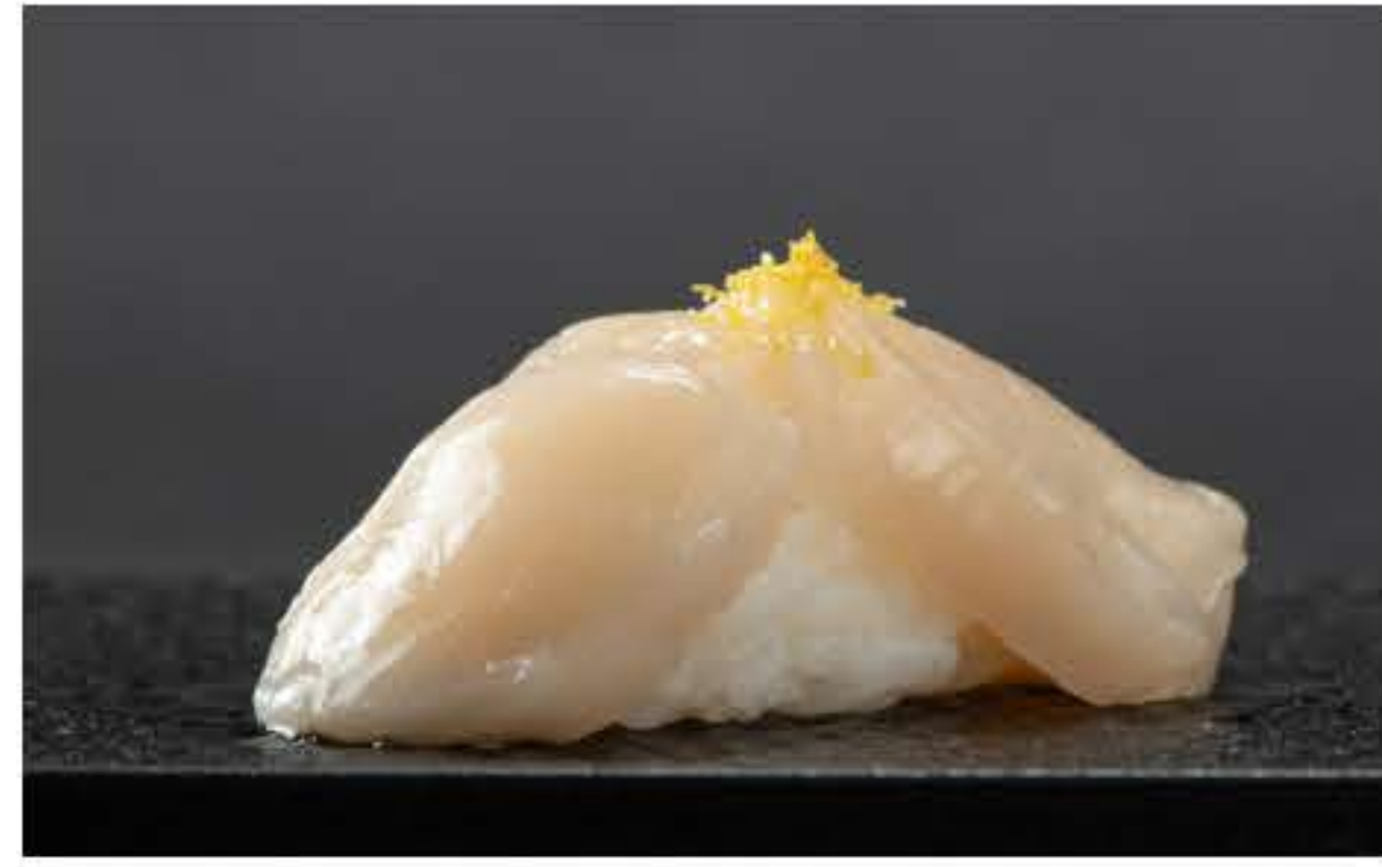
Scallop Nigiri 扇贝握寿司