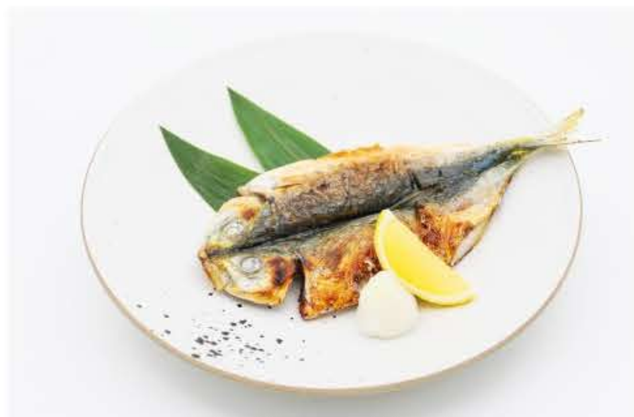
Char-Grilled Horse Mackerel 盐烤开边竹夹鱼