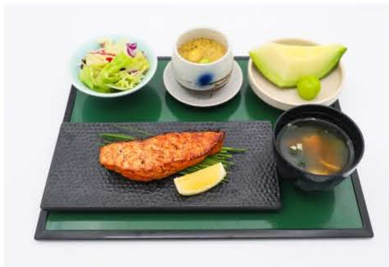
Grilled Salmon Steak Set 烤三文鱼排定食