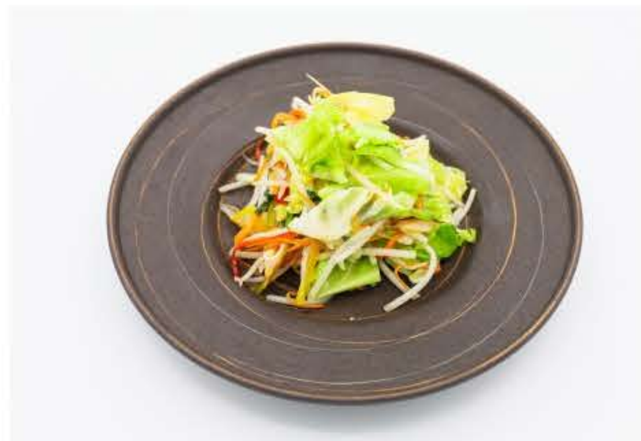
Assorted Vegetables Teppanyaki 铁板炒时蔬