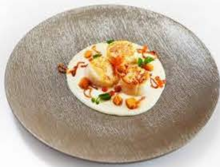
Scallop Pepper Yuzu Butter 活扇贝红葱碎山椒柚子汁