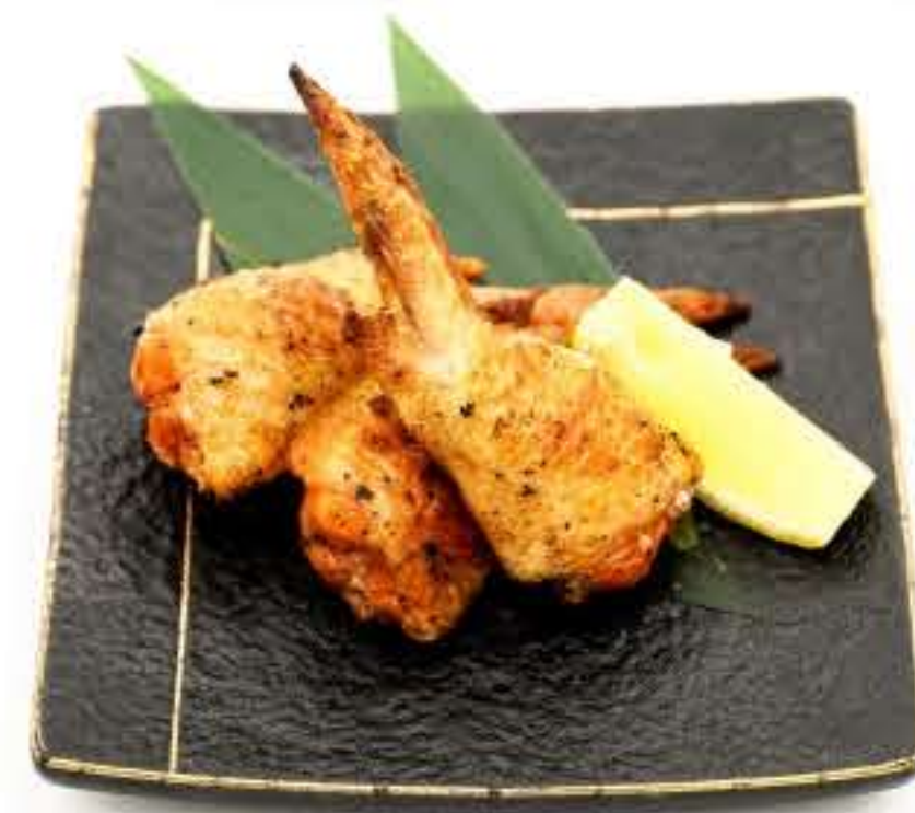
Chicken Wing Gyu-Za 鸡翼饺子