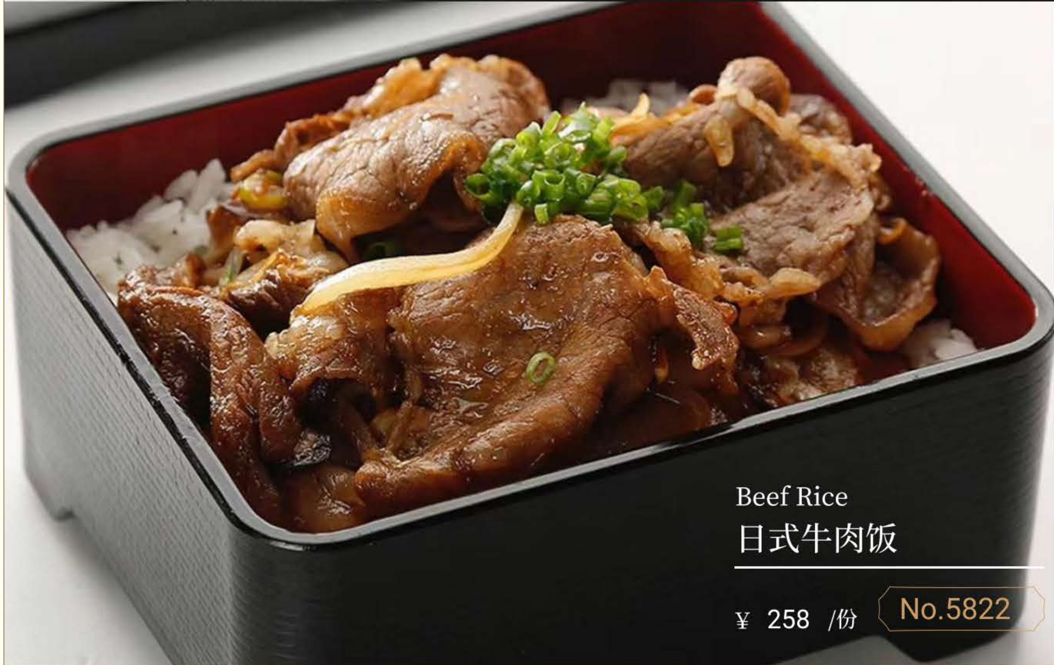
Beef Rice 日式牛肉饭