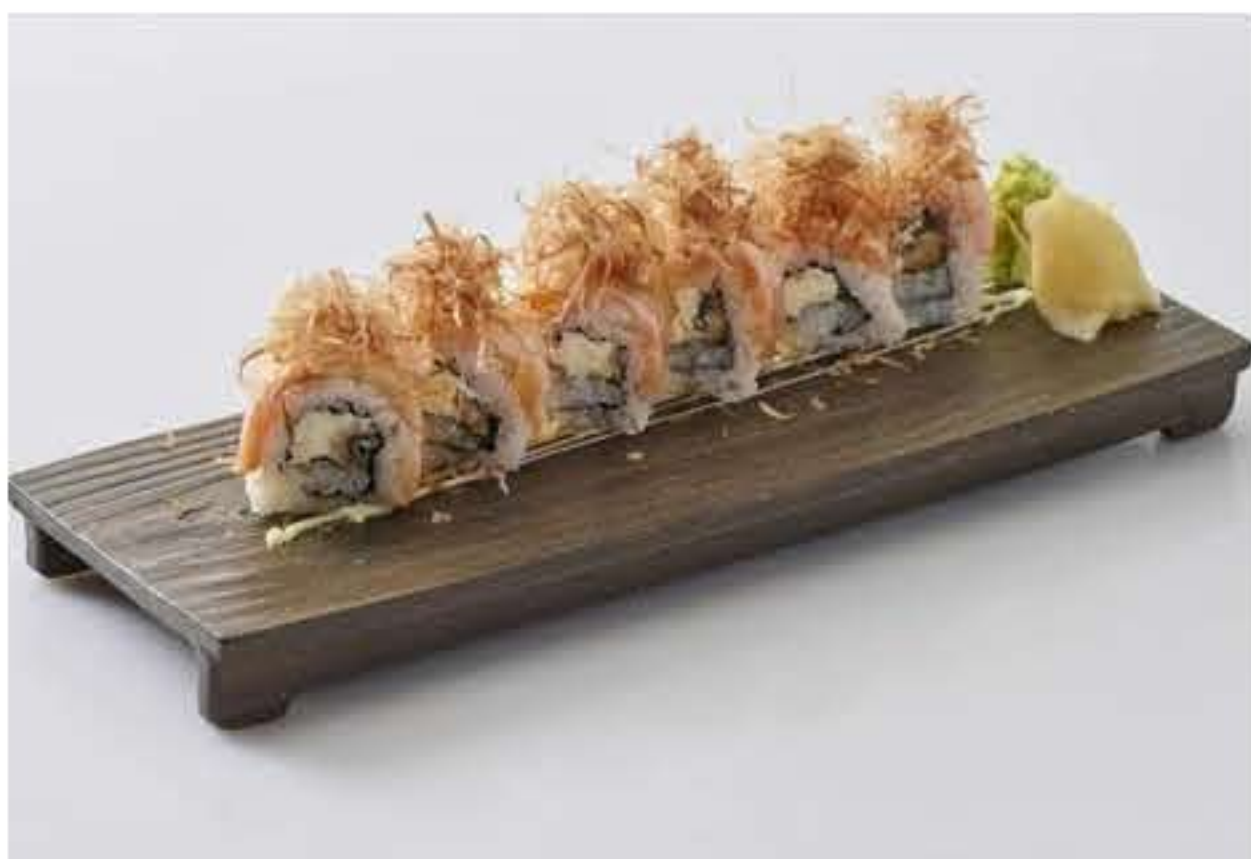
Flamed Salmon Maki 火炙三文鱼寿司卷