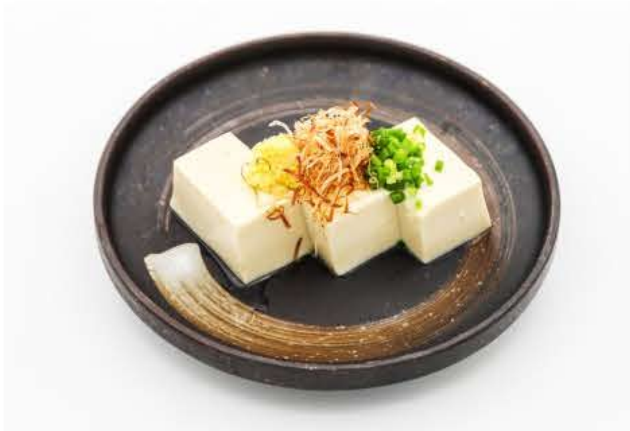
Cold Bean Curd with Bean Curd Sauce 冷豆腐