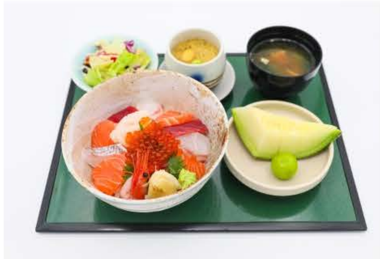
Sashimi Bowl Set 西村什锦海鲜饭定食