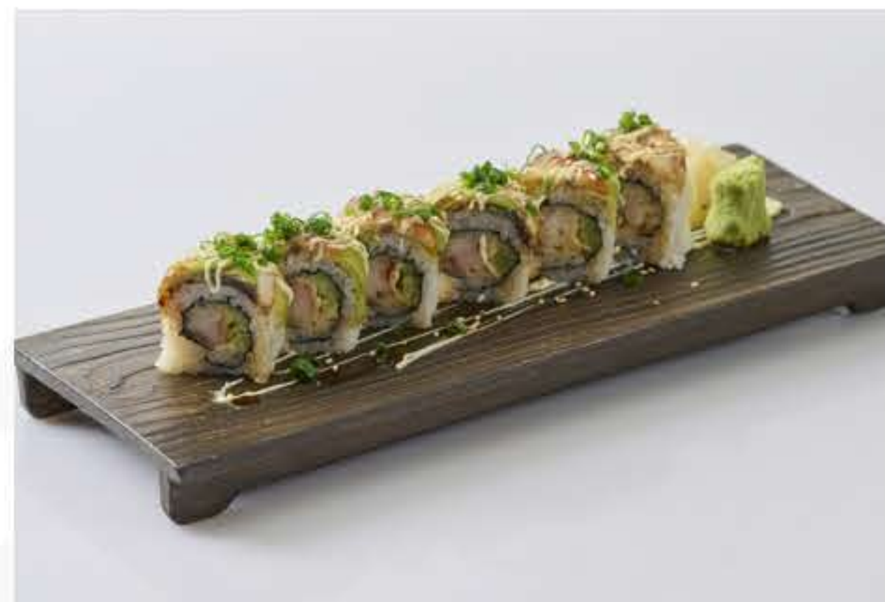
Eel Maki 鳗鱼龙卷