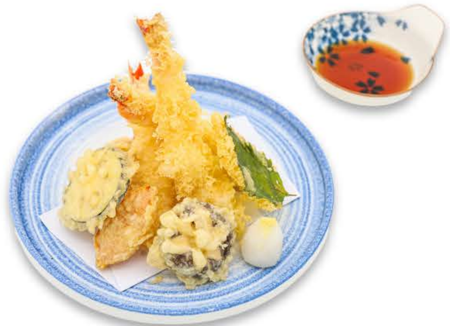
Assorted Tempura 什锦天妇罗