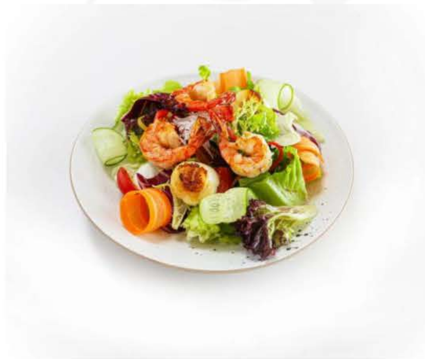
Sautéed Shrimps and Scallop Vegetables Salad 大虾扇贝蔬菜沙拉