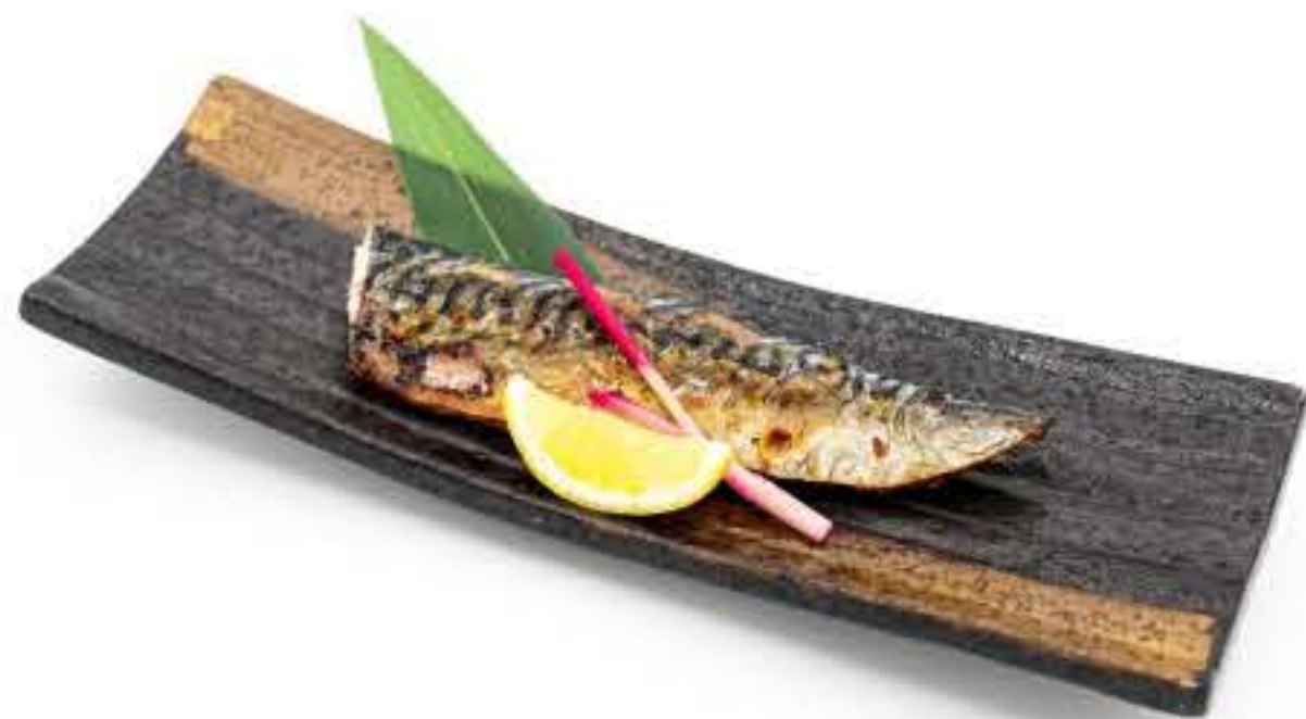
Char-Grilled Mackerel 盐烤鲭鱼