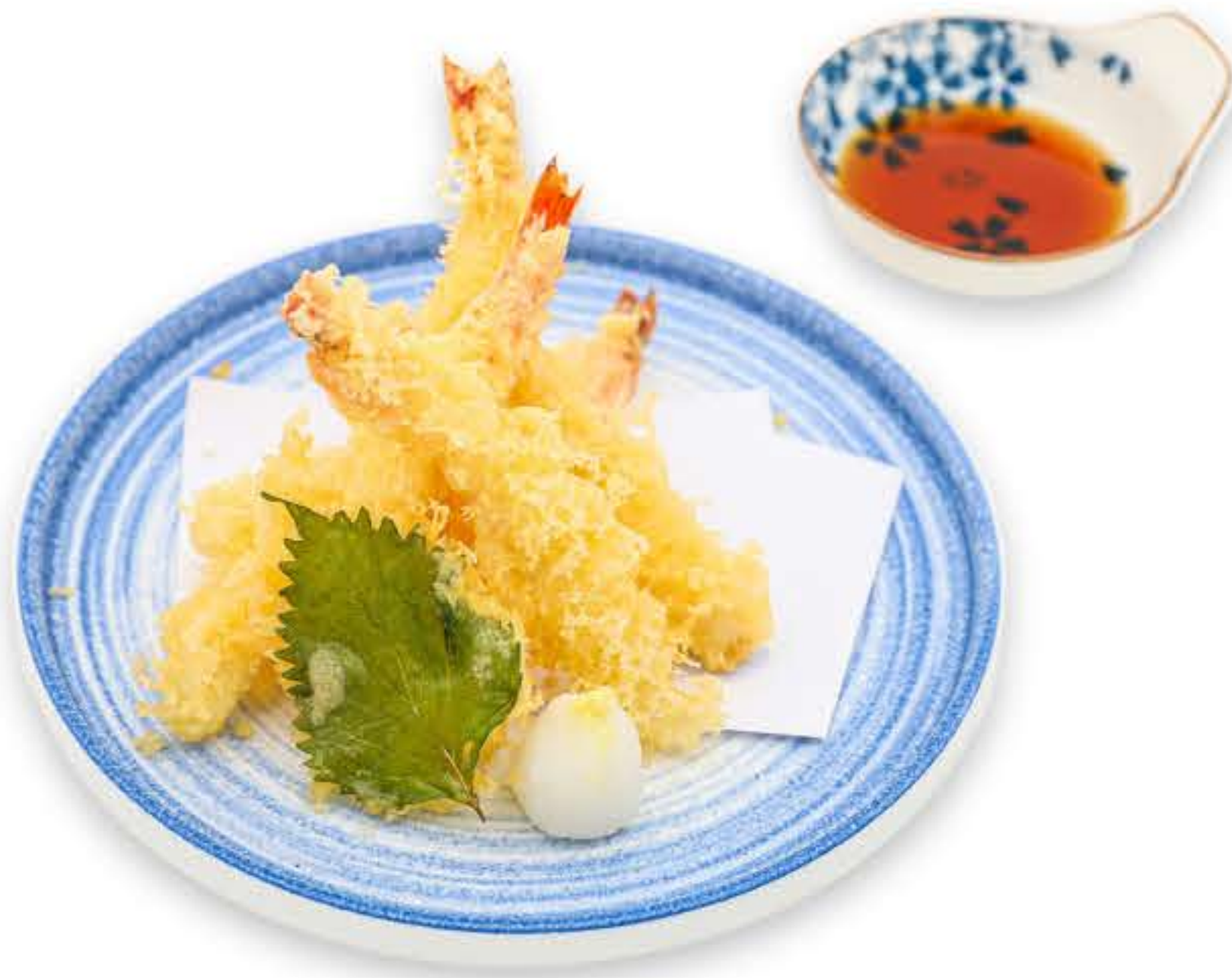
Prawn Tempura 虎虾天妇罗