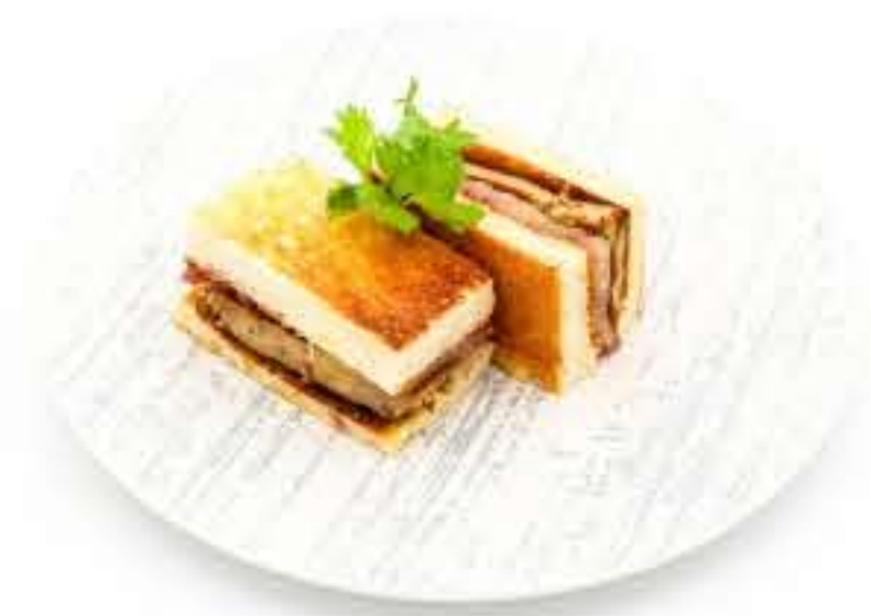
Duck Liver Sandwich 鸭肝三文治