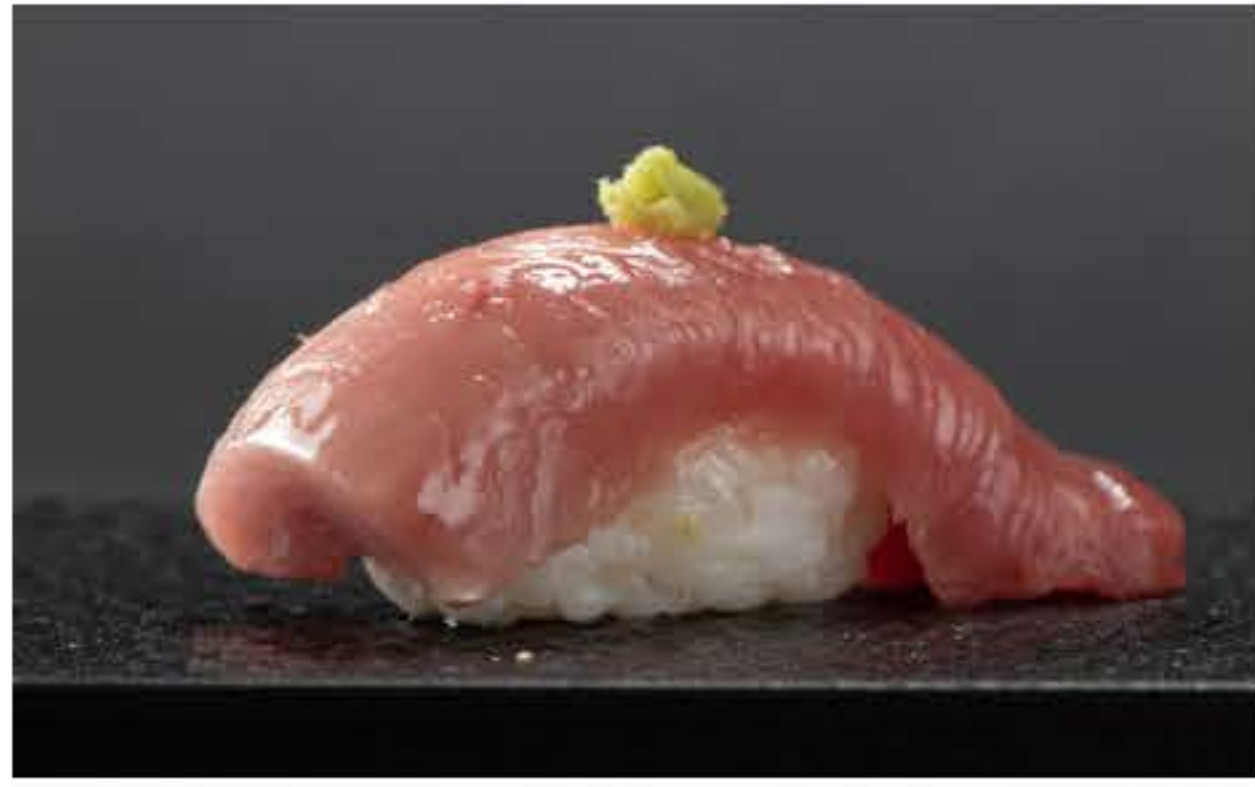
Toro Nigiri 金枪鱼大腹握寿司