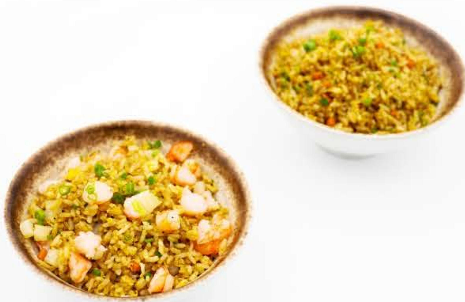
Garlic Fried Rice with Egg 蒜香鸡蛋炒饭