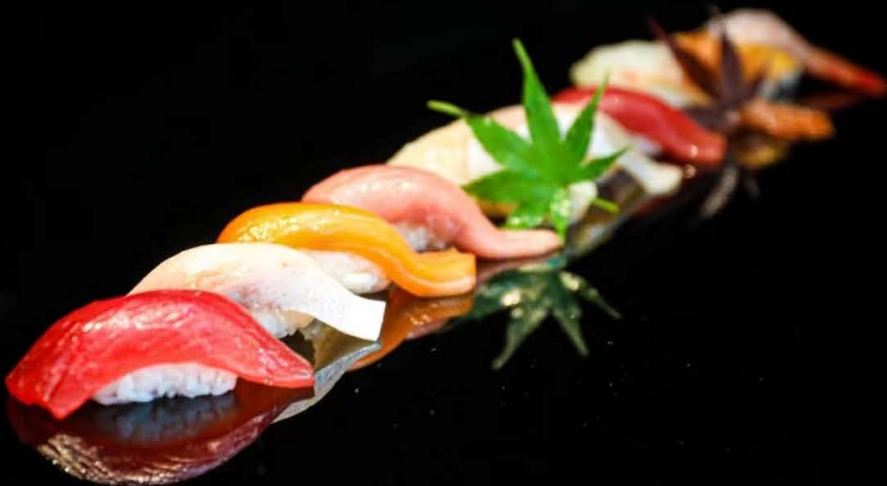
Sushi Selection Platter (10 Kinds) 特选寿司拼盘 (10种)