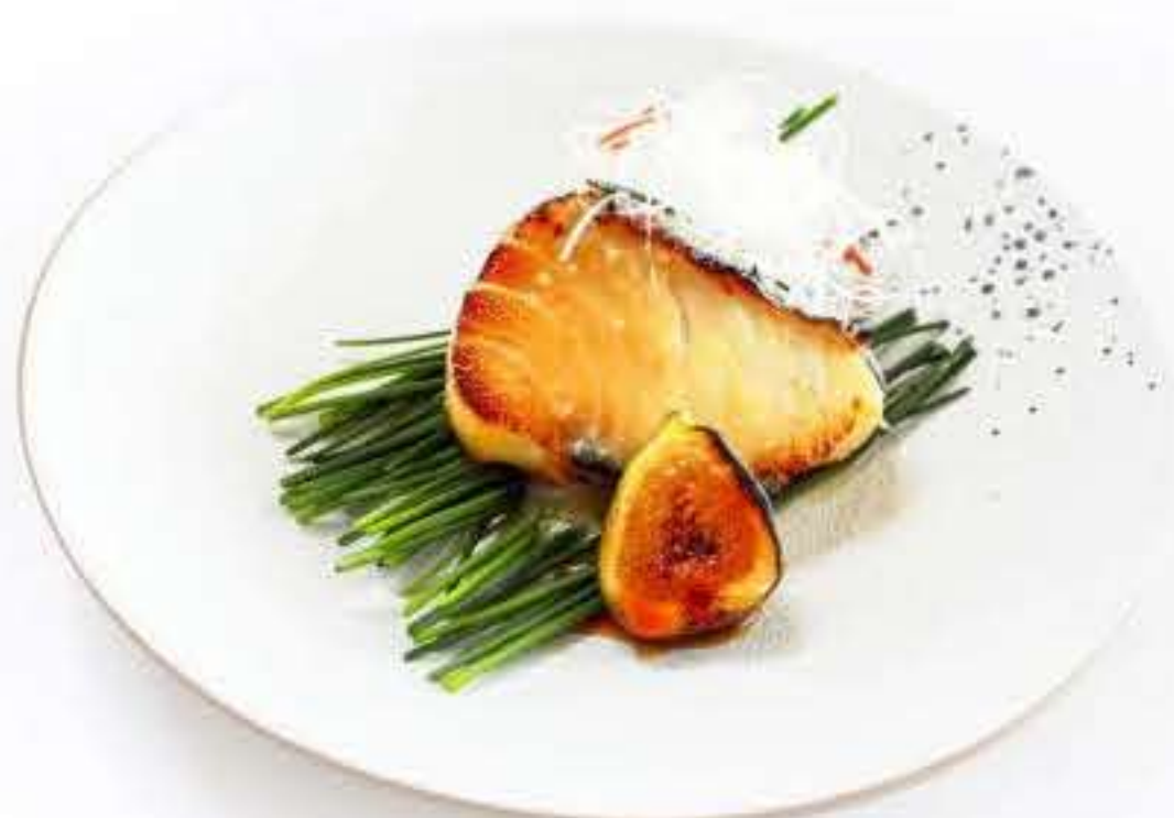
Marinated Black Cod with Yuzu Miso 西京烧鳕鱼