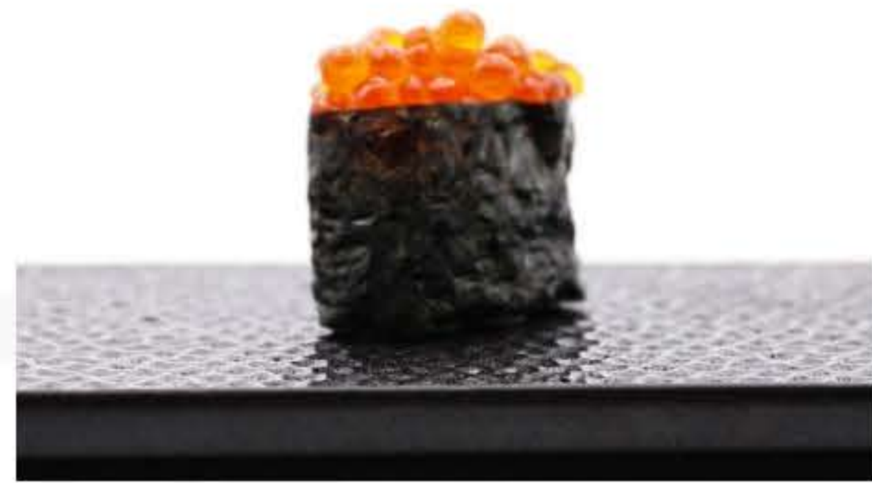
Salmon Roe Battleship 三文鱼籽军舰