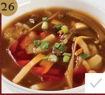
26. 四川海皇酸辣汤 Hot and Sour Soup with Seafood ซุ๊ปเสฉวนทะเล