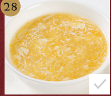
28. 蟹肉粟米 Braised Sweet Corn Soup with Fresh Crab Meat ซุ๊ปข้าวโพดเนื้อปู