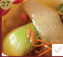
27. 养生珍菌杞子汤 Double Billed Mushroom Soup ซุ๊ปเห็ดสมุนไพรง่ายๆ