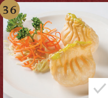
31. 芝麻香虾卷 Deep-fried Shrimp and Sesame Spring Rolls ปอเปี๊ยะกุ้งทลีน