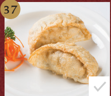
35. 香煎萝卜糕xo Stir-fried Turnip Cakes with xo Sauce ขนมผักกาดผัดซอสเอ๊กซี่โอ