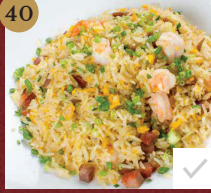
40. 扬州炒飯 Yangzhou Fried Rice with BBQ Pork and Shrimps ข้าวผัดหยางโจวหมูแดงและกุ้ง