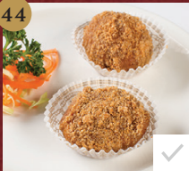
41. 軟滑香芒布丁 Chilled Mango Pudding มะม่วงหู้ตึง